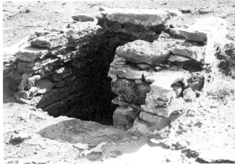
Pou d'es Verro.

L'any 1246 Guillem de Montgrí donava en feu a Berenguer Renart tota l'illa de Formentera. El document original d'aquesta donació està a l'Arxiu Històric de la Pabordia d'Eivissa; 3 el transcrigué Josep M. a Quadrado, i d'ell el va copiar al peu de la lletra I. Macabich. 4 Però hi ha una gran irregularitat en els dos historiadors: que acaben la dita transcripció llatina amb un inadmissible ETC., com dient, ja hem acabat, per fi. I aquesta parauleta, ETC., resulta que encobreix un gran error, ja que està en lloc de la següent afirmació final del dit document de Montgrí: «Però feim aquesta donació deixant de banda la quarta part que posseeix l'infant de Portugal en l'esmentada illa». ¿Es podia dir més clar que Formentera havia estat dividida? No ens ha d'estranyar que Montgrí parli tan senyorialment, dient que li dóna tota l'illa de Formentera; era el temps en què li agradava anomenar-se senyor d'Eivissa i Formentera, i a més a més ell tenia tres quartons a cada illa, perquè havia comprat ja el que havia tocat a Nunó Sanç. Així que en dir tota l'illa s'ha d'entendre que vol dir que li dóna les seues tres quartes parts, o sia els seus tres quartons de Formentera.