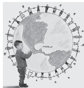
Taula 6. Mural i debat sobre “La guerra dels botons”