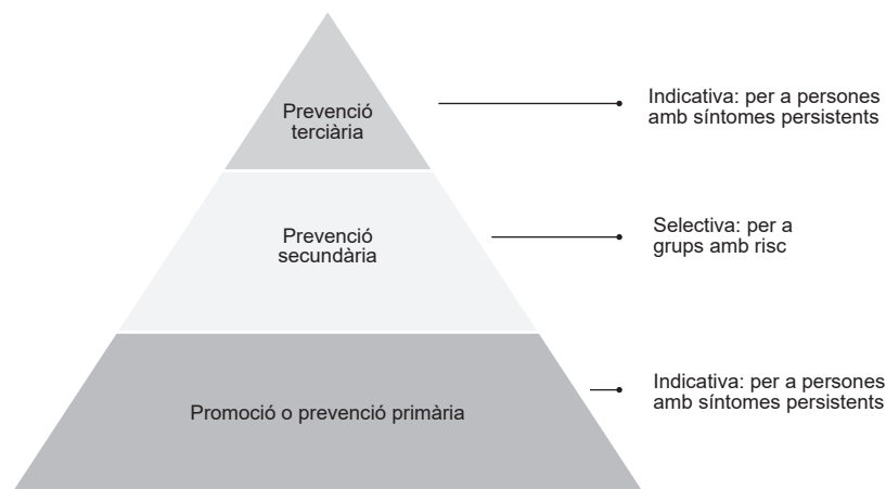
Figura 2: Model d'intervenció psicosocial - OMS

En general, en parlar de prevenció es fa referència al canvi social relacionat amb el desenvolupament de recursos de la comunitat on s'intervé. "Es tracta de potenciar recursos existents i posar-los al servei d'un projecte col·lectiu i de crear nous recursos que atenguin necessitats no ateses pels propis recursos comunitaris" (Rodrigo i Palacios, 2008, p. 510).