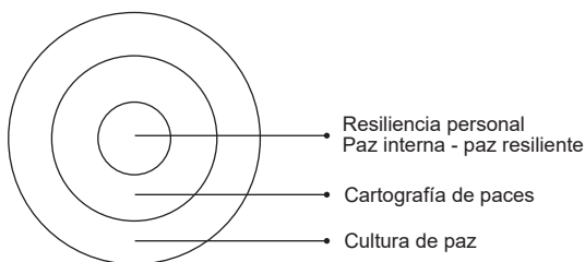
Cuadro 1. Relación entre paz y resiliencia

La paz resiliente es diferente de la paz interna, aunque se relacionan con el individuo. La paz interna o paz personal (equilibrio), según el concepto de Valdez (en Moral de la Rubia et al. , 2011), “se considera que [...] es un estado caracterizado por la sensación de seguridad, confianza, tranquilidad, estabilidad, autoorganización y disponibilidad de energía” (2011, p. 3). Los autores Moral de la Rubia et al. (2011) observan que el miedo surge como una respuesta natural del individuo cuando la paz se disipa o cuando existe el riesgo de perderla.