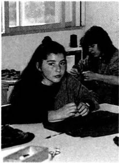
Aula-Taller Cruïlla. Confecció