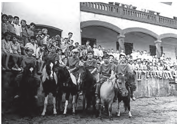
Fig. 7. Grup de nens fent jocs amb ponis al pati de Wad Ras als anys cinquanta.