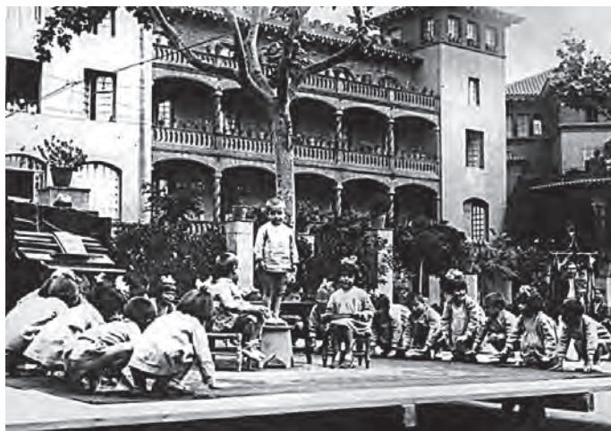
Fig. 2. Grup de nenes i nens en una actuació a inicis dels anys vint.