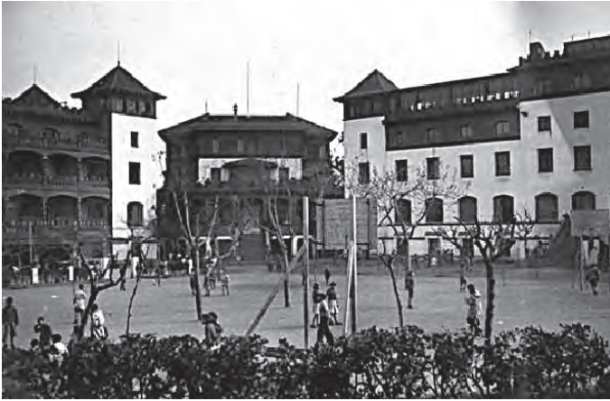
Fig. 4. Vista del pati de Wad Ras amb nens i nenes a mitjan anys trenta.