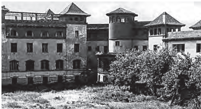
Fig. 8. Vista de l'interior de Wad Ras - Institut Ramon Albó, a inicis dels anys setanta, en estat d'abandonament i degradació.