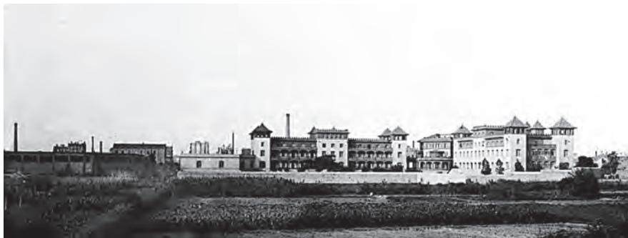
Fig. 1. Vista posterior de Wad Ras a inicis dels anys vint.

Arribem a la fi d'aquest trajecte, que no vol ser el viatge definitiu perquè les recerques històriques sempre són provisionals i poden ésser enriquides amb fonts noves o amb l'explotació diferent de les existents. De ben segur que encara podrem accedir a noves aportacions que ens apropin al que milers de nens i nenes van viure en la seva infància al Grup Benèfic, amb els seus noms i moments diferents.