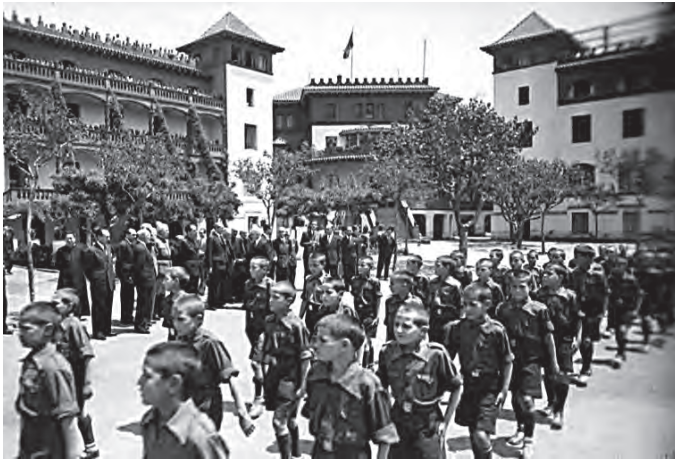
Fig. 5. Nens interns a Wad Ras, desfilant davant de caps de la Falange a inicis de la dècada de 1940.