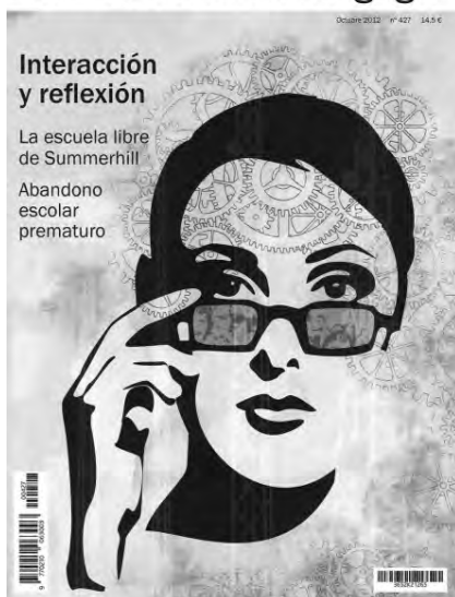
IMAGEN 2. Revista Cuadernos de Pedagogía, 427 (2012)