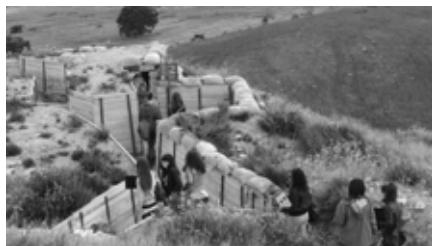
Figura 6. Recorregut per les trinxeres del Merengue.

A partir d'un recull de fonts primàries, es proposa a l'alumnat un treball per a comprendre les conseqüències que van derivar-se de la victòria franquista per a la població de Catalunya: la instauració d'una dictadura militar, l'exili, la repressió política, laboral i cultural, etc.. En concret es treballa l'acondicionament a Balaguer d'uns locals per utilitzar-los com a presó i el nombre de presos que hi van ser reclosos.