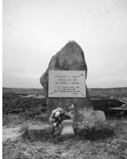
Figura 8. Monòlit en record dels soldats de la lleva del biberó morts a la Batalla del Merengue.