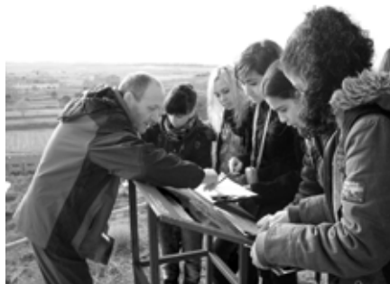
Figura 5. Observant en els plafons la localització de les tropes en el front.

Aquesta proposta és un treball cooperatiu que demana a l'alumnat d'adoptar la posició d'un corresponsal de guerra estranger enviat al cap de pont de Balaguer i fer una crònica per