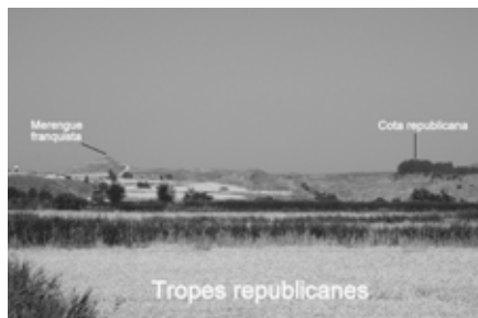
Figura 4. Espai on va desenvolupar-se la Batalla del Merengue, en el Front del Segre.

La visita als espais de memòria de la Batalla del Segre es complementa amb una sèrie d'activitats d'aplicació i consolidació que es desenvoluparan a l'aula amb posterioritat a la visita. Per donar coherència curricular a tota l'activitat, en la realització de les activitats proposades es fomentarà el treball en equip, la gestió i el raonament crític de la informació recopilada i dels aprenentatges adquirits, la capacitat de posar-se en el lloc de l'altre