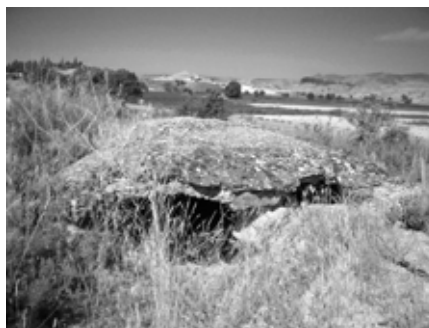
Figura 1. Restes d'estructures bèl·liques del Front del Segre. Carretera Balaguer – Camarasa.

batalla del Segre, i en especial la posició del Merengue, ofereixen un patrimoni arqueològic de la guerra que fan d'aquest espai bèl·lic un marc idoni per articular al seu voltant un discurs comprensible i didàctic sobre aquests fets històrics i avançar cap a plantejaments de la didàctica patrimonial en els espais de memòria.