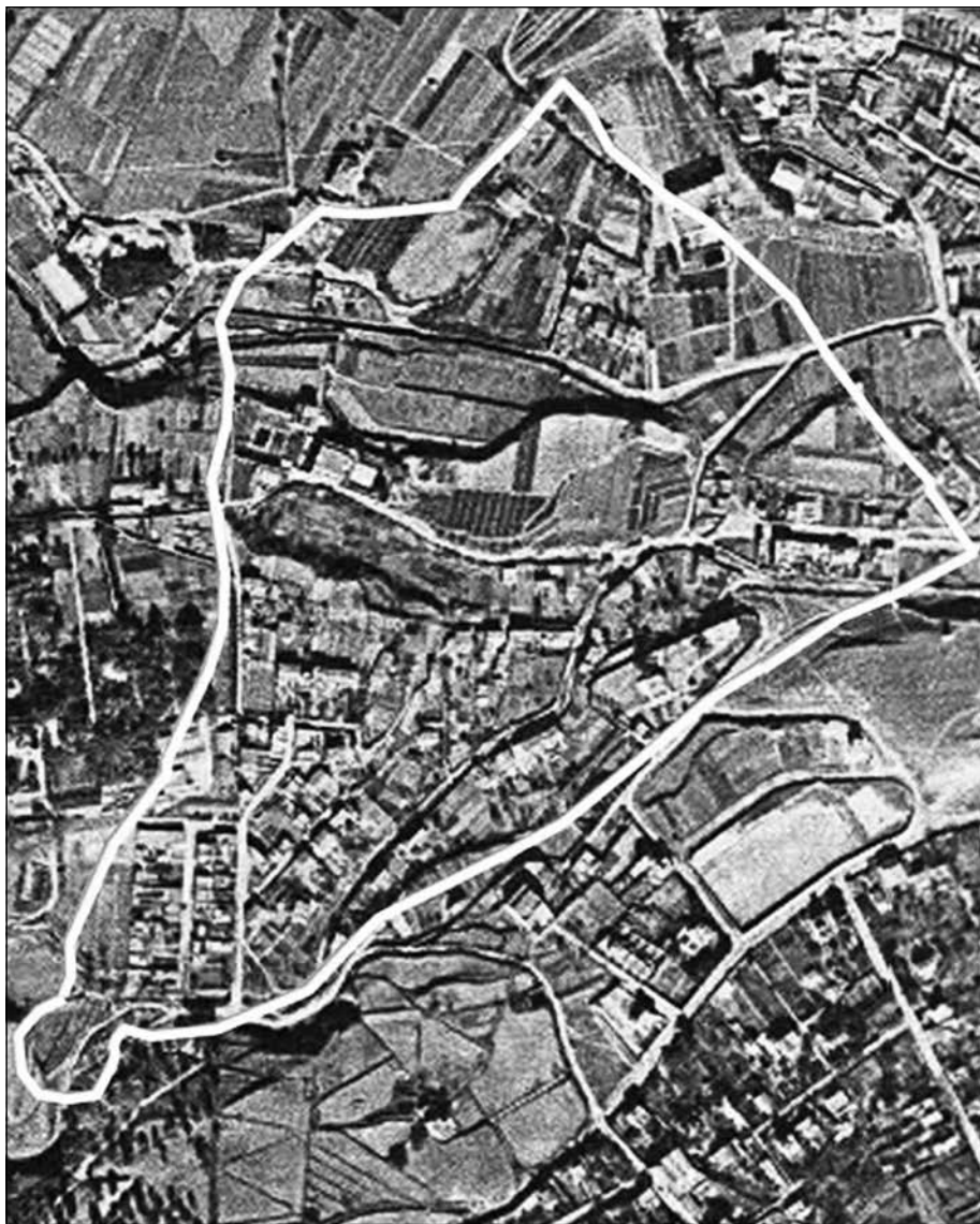
Fotoplànol amb el contorn de la Clota actual

Si caminem per les zones més urbanes, ens trobem amb cases, horts, safareigs, basses, pous i parets de pedra, que res ens diuen de modernitat i corrents arquitectòniques, aproximadament cent-cinquanta masos i cases de cos. Si caminem per les parts no edificades; ens trobem amb murs