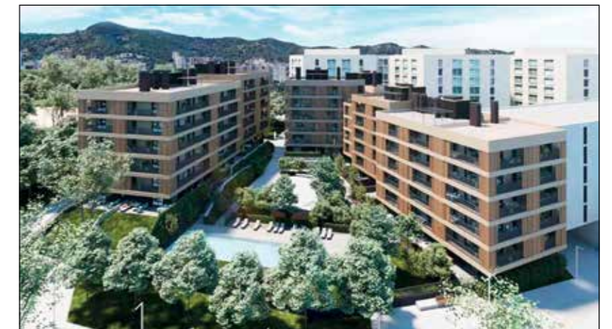
Noves construccions a la Clota. A la dreta, publicitat de la venda de pisos en la Clota Reordenació