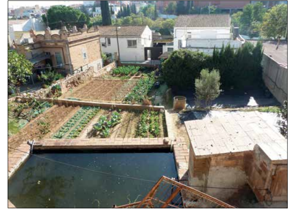
Verd salvatge de bardisses, arbusts i arbres sobrevivents d'antics cultius abandonats. A la dreta, horts, safareigs i basses