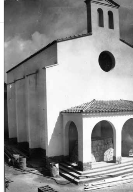
Capella Sagrada Família en construcció (1957)

A principis dels anys seixanta, la construcció del nucli d'habitatges de Montbau, i la proximitat de la Residència Sanitària i de les Llars Mundet va