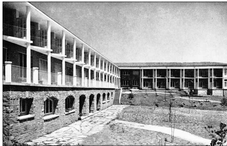
Hogar de Matrimonios Ancianos. Vista parcial terrasses habitacions (1958)

correcte funcionament d'acord amb les seves necessitats, sinó també amb la idea de mostrar un aspecte exterior que fes la sensació de llar.