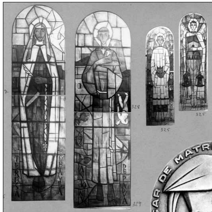
FONS RIGALT, GRANELL I CIA, MDB

Santa Teresa d'Àvila, Sant Antoni de Pàdua, Sant Lluís de Gonzaga, Sant Miquel Arcàngel. Dibuixos per a vitralls (1957). A baix, Medalla commemorativa inauguració de l'Hogar de Matrimonios Ancianos (1958)