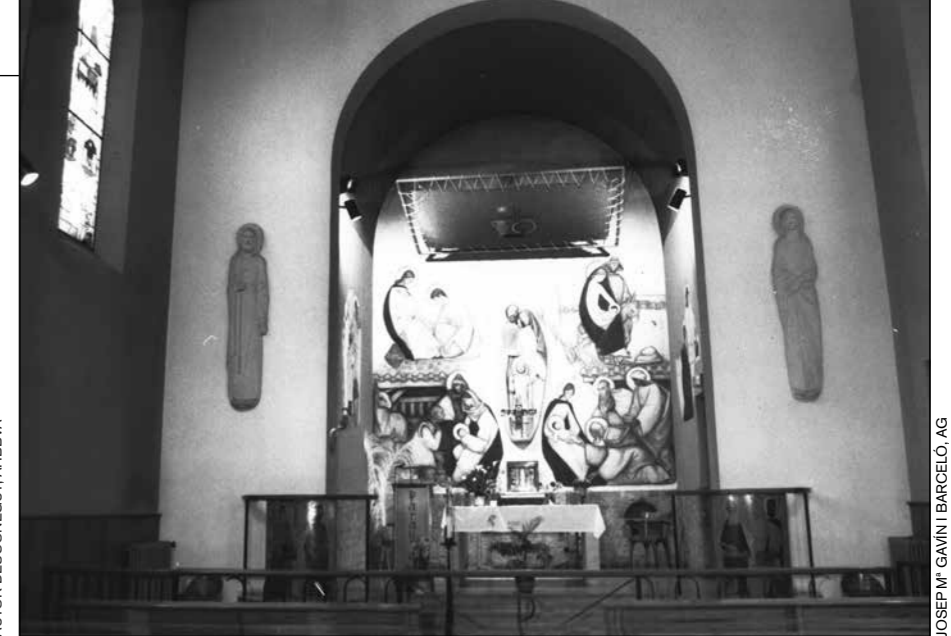
Capella Sagrada Família. Detall (1998) -

pressupost de dues-centes mil cinc-cents pessetes per a la decoració del presbiteri i de la capella de la Llar, amb pintures murals al fresc, i els dibuixos dels vitralls. (8)