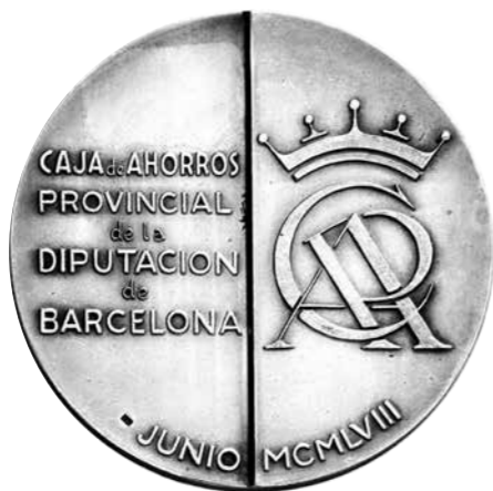
AUREOCALICO, SUBHASTES NUMISMÁTICAS

edificis modernistes més importants de Barcelona, com el Palau de la Música i l'Hospital de Sant Pau (12). Hi eren representades les figures de l'Arcàngel Sant Rafael, Sant Camil de Lel·lis, Sant Ignasi de Loiola, l'Arcàngel Sant Miquel, Sant Lluís de Gonzaga, Sant Antoni de Pàdua i Santa Teresa d'Àvila, i la rosassa mostrava una al·legoria de la Santíssima Trinitat (13). Curiosament no hi havia cap vitrall dedicat a l'Arcàngel Sant Gabriel, que sí que apareixia al mural de l'Anunciació del presbiteri.