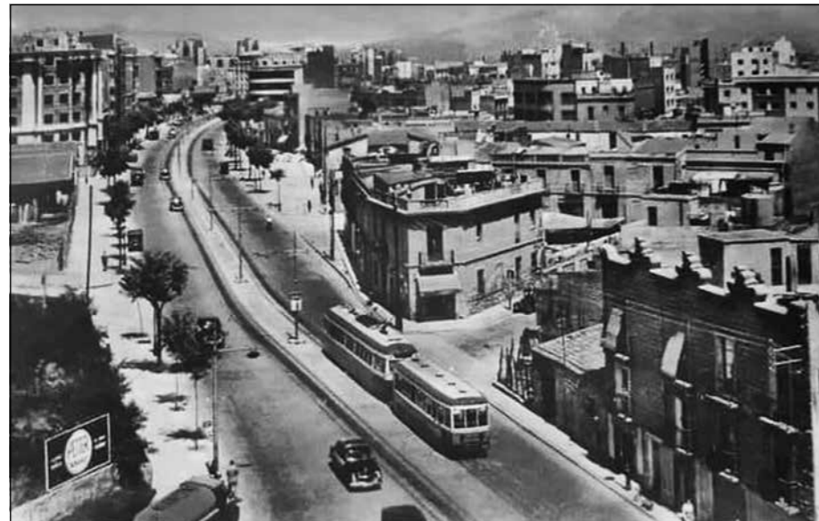
El passeig de Maragall els anys cinquanta. A l'esquerra, el solar de les oliveres

narració es lamentava del destí d'aquelles oliveres condemnades, després de segles de vida productiva. (2) L'article relacionava directament aquells arbres amb la urbanització del Guinardó i des d'El Pou ens vam interessar per aquell darrer vestigi rural del barri.