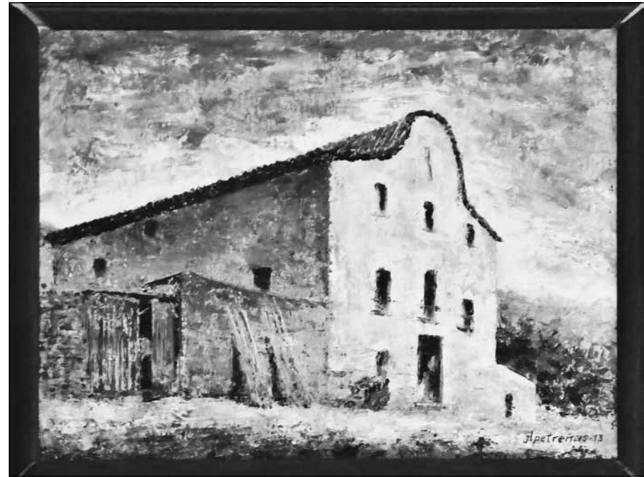
Pintura de la masia de can Baró

JLP. Jo ja coneixia el barri. La plaça no estava asfaltada. Jo venia a la casa-barraca d'un amic a mitja muntanya i fèiem excursions a la pedrera per la