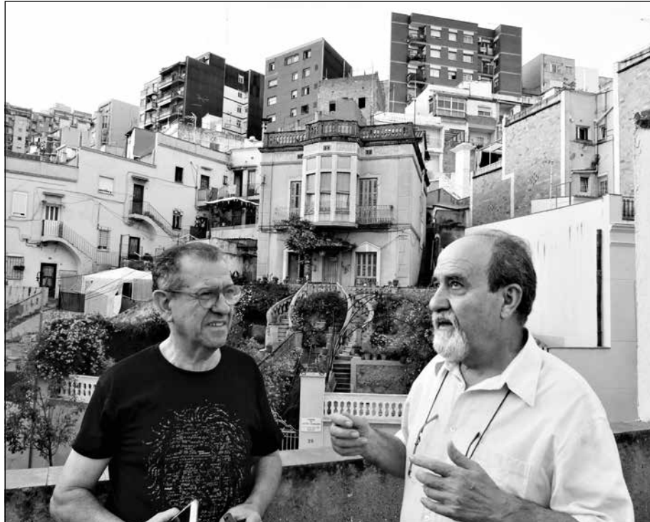
Petreñas amb el redactor d'El Pou a la terrassa de casa seva amb la vista del barri de Can Baró amb les cases construïdes a diferents nivells