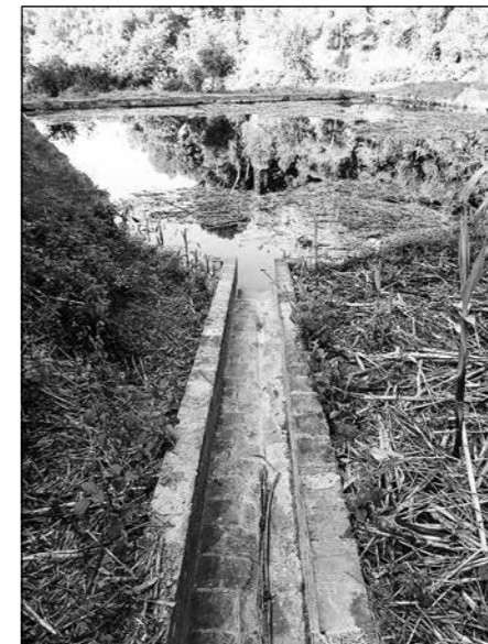
Canal al cantó més alt de la bassa que condueix l'aigua de pluja

vall van ser contínues i punyents en segles anteriors. L'Hospital de la Santa Creu havia comprat la finca Santgenís el 1890 i ara estava en tràmits de la compra de la finca Masdeu, (3) així que la captació i explotació de l'aigua de pluja del "pantano" no ocasionaria disputes. Tampoc sabem si el càlcul de 4000 m 3 que el perit estimava era real quan l'obra estigués acabada o era una apreciació per millorar les qualitats de la finca de cara a la venda.