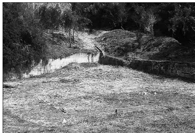
La bassa el mes de març de 2020 un cop retallada la vegetació que la ocultava