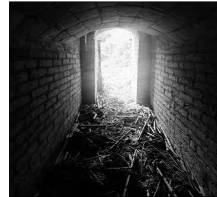
Interior de mur de contenció prop del desaigüe

No sabem si la obra del "pantano" es va acabar i si l'aigua va tenir algun ús. L'entrada d'aigua a la bassa és a través d'un gran canaló situat al mig del torrent que devia desviar part de les aigües que baixaven. A ben segur en altres temps aquesta captació hagués portat disputes amb les finques veïnes. La finca contigua a can Masdeu baixant el torrent era can Santgenís (ara a tocar de la plaça Karl Marx) i les disputes entre les dues propietats per la captació de l'aigua d'aquella