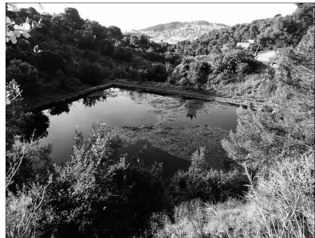
Imatge inusual de la bassa completament plena després de les pluges del mes d'abril 2020. Al fons, els Tres Taurons