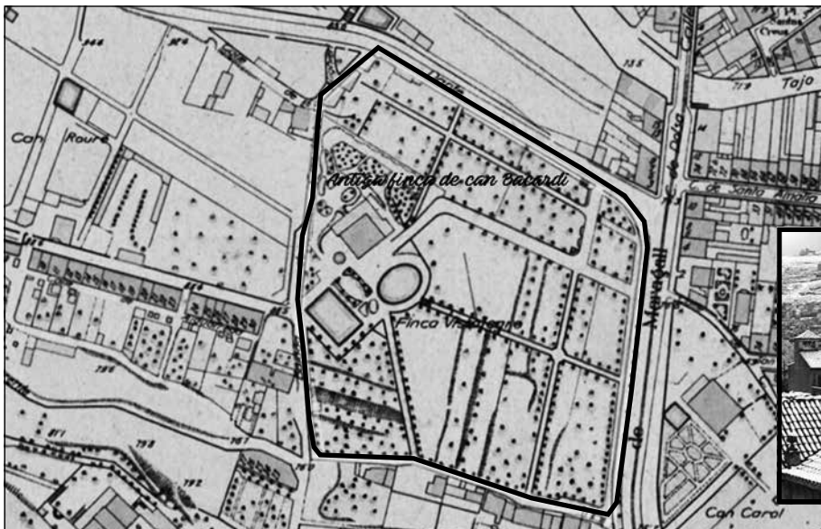
Plànol de 1930 amb la situació de la finca Bacardí. A la dreta una imatge de la mateix època de la propietat

Una part de la finca que incloïa la casa-torre va ser venuda el 1950 a les religioses de la Immaculada Concepció