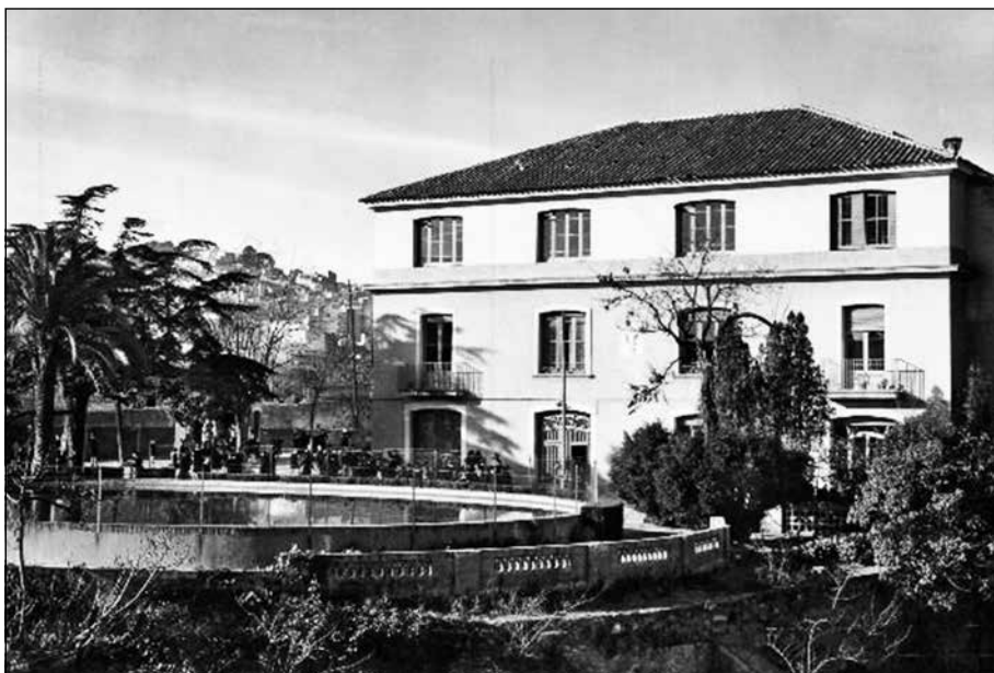
Can Bacardí a la inauguració de l'escola, a l'octubre de 1951