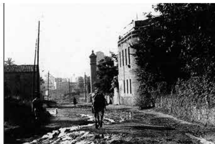
Riera d'Horta i al fons el pilar de Cartellà