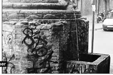
Font del pilar del carrer Cartellà

una font rèplica de la font de Canaletes de la Rambla que és la que hi ha actualment al mig de la plaça.