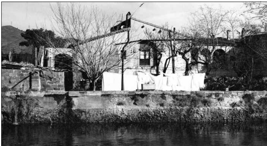
Una imatge de la masia de can Travi Vell, amb els llençols assecant-se al sol