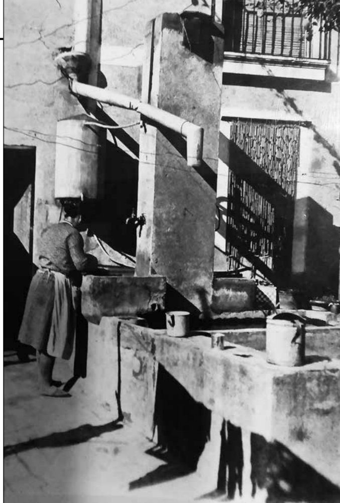
La Tereseta de can Caparrada fent de bugadera