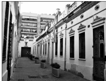
Passatge Roger de Flor