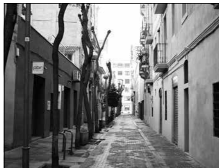
Passatge de Gaiolà