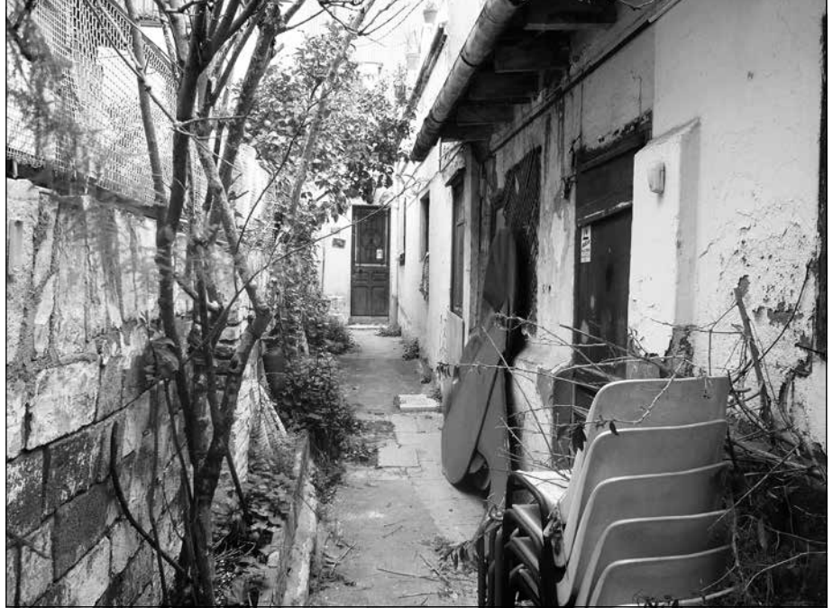
Passatge de Sant Pere

Us proposem una manera diferent de veure la nostra ciutat a través dels passatges. Barcelona en té més de 400. Nosaltres només farem una passejada per alguns d'ells. Passatges n'hi ha de molts tipus, la majoria porten el nom del propietari dels terrenys on es van construir. Altres són producte dels accidents naturals, per exemple dels torrents, o de camins, o bé del procés d'industrialització, o també per fer cases de segona categoria per a treballadors, moltes vegades de les fàbriques properes. També per a la construcció en l'espai interior de les illes del pla Cerdà, incrementant el perímetre edificable dels constructors especuladors per tal d'enriquir-se encara més.