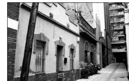
Passatge de Lluïsa Vidal, abans lletra B

11. Catalunya. Passat el carrer Sant Quintí trobem el passatge Catalunya. Aquest nom és un antic vestigi de quan, a començaments