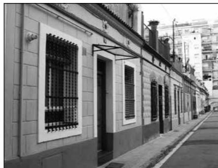
Passatge de Torres