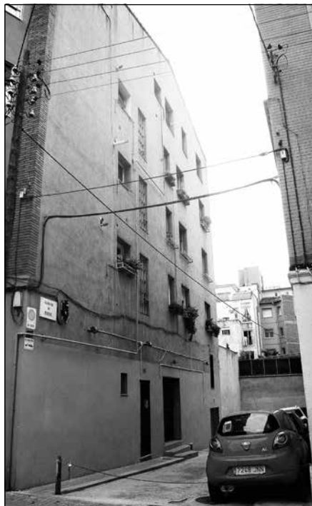
Passatge de Mariner

Districtes diferents d'acord amb les divisions actuals de la ciutat, encara que veurem que no sempre va ser així. Començarem pel Baix Guinardó (Districte Horta-Guinardó), pel barri del Poblet, anomenat avui dia Sagrada Família (Districte de l'Eixample) i per el camp d'en Grassot (Districte de Gràcia).