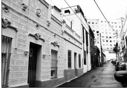
Passatge de l'Encarnació

2 abril 2017 / Notes: Carles Sanz . Fotos: Juanjo Fernández