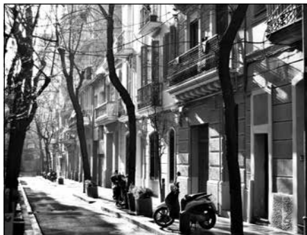
Passatge de Maiol