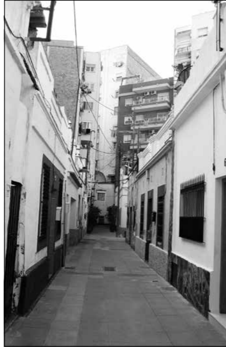
Passatge de Pau Hernández