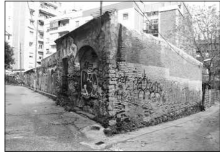
Torrent de Lligalbé

antics del pla de Barcelona, ja esmentat el segle XII. Va quedar mutilat per l'obertura del carrer Lepant.