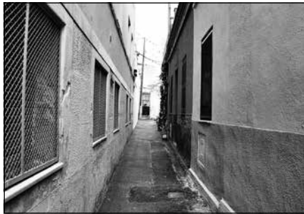
Passadis de l'Encarnació