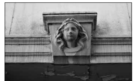
Detall al passatge de la Igualtat

9. Sense nom. Al carrer Independència, enfront del passatge anterior, queden les restes d'un antic passatge totalment ocupat per les cases dels costats. Un lloc fosc, una