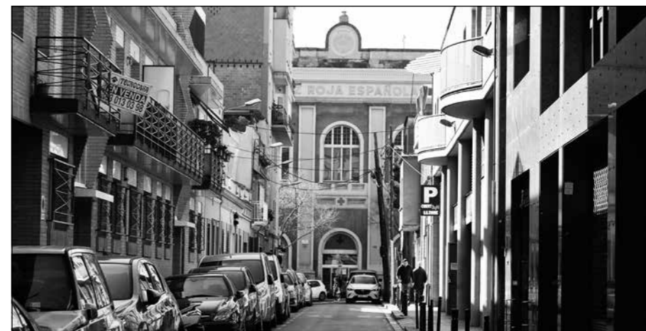
Passatge de la Independència, amb l'Hospital de la Creu Roja al fons