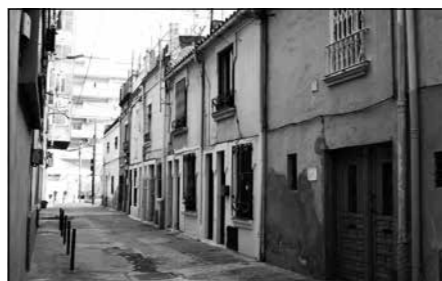
Passatge de Conradí

Passatge conegut com de les Torres quan s'obrí en els paratges entre la Travessera