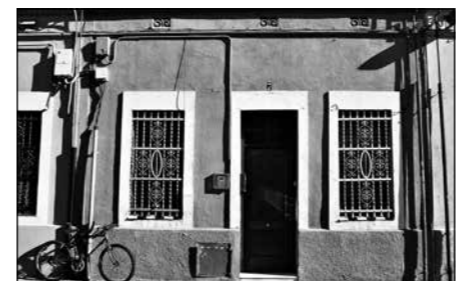
Casa al passatge de Sant Pau

6. Ureña. Segons el Nomenclàtor de Barcelona, aquest passatge es va obrir en so-