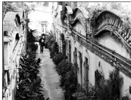
Passatge Roselló 425