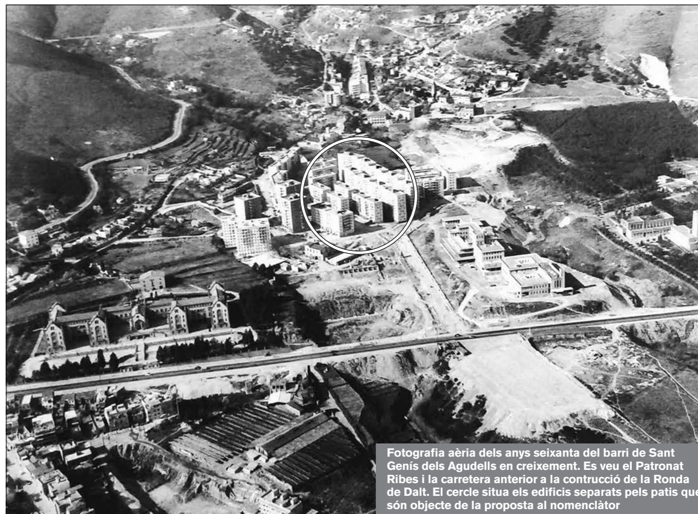
Fotografia aèria dels anys seixanta del barri de Sant Genís dels Agudells en creixement. Es veu el Patronat Ribes i la carretera anterior a la construcció de la Ronda de Dalt. El cercle situa els edificis separats pels patis que són objecte de la proposta al nomenclàtor

Les aigües del torrent de la font del Bacallà baixaven per la fondalada fins a fondre's amb altres torrents propers formant el que era la riera de Sant Genís. On abans hi havia el seu curs s'hi van construir el carrer del Lledoner, els jardins de Violant de Bar i els patis entre els carrers Sidó i Lledoner. Aquests patis tancats sense accés van ser durant cinquanta anys un problema de salubritat. L'any 2013 l'Ajuntament va procedir a reformar aquest espai