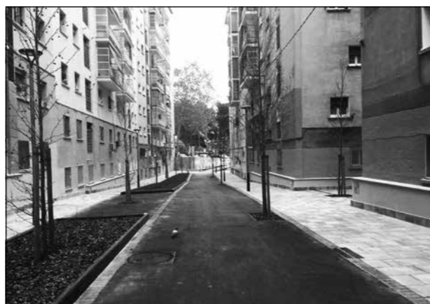
Abans i després d'arranjar-se els patis entre Sidó i Lledoner

de cinc minuts arribem a un esplanadeta on es troba la font rajant aigua des d'un pilar de pedra vista.