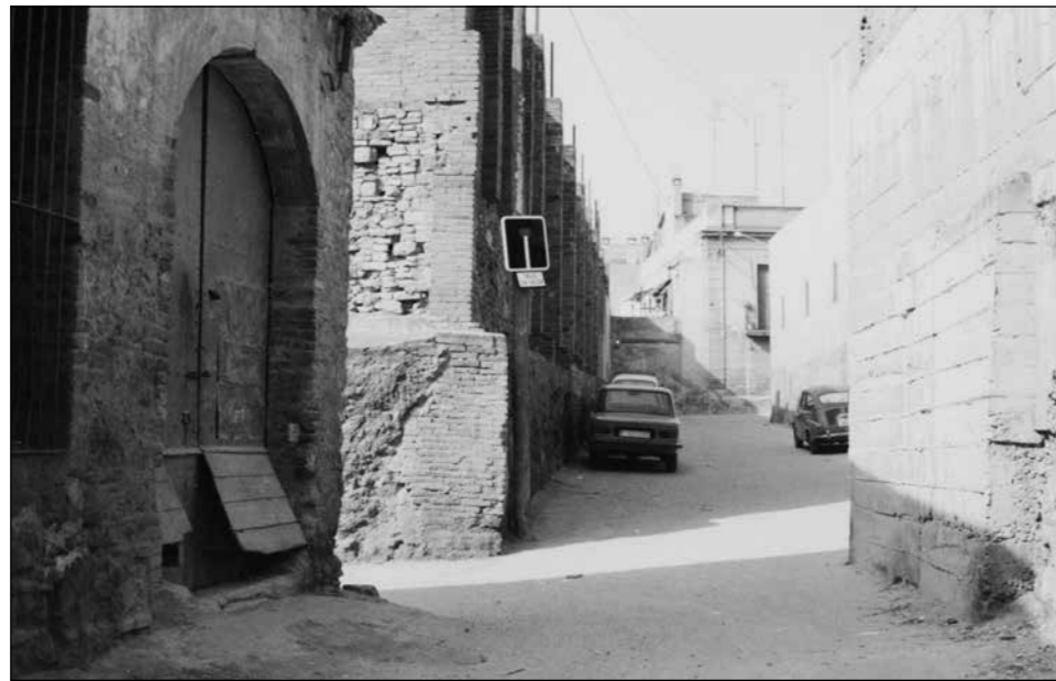
En aquest indret, avui molt malmès, el camí de la Llegua i el torrent de Lligalbé es separaven