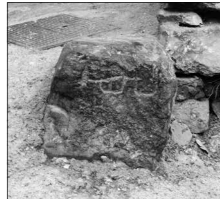
La fita de Lligalbé