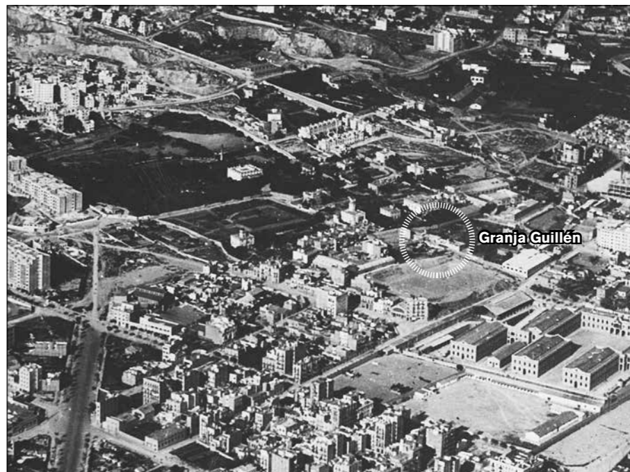
La granja Guillén en una fotografia aèria dels anys cinquanta

d'allà, el torrent i el camí compartien un tram però es tornaven a separar. El camí de la Llegua seguia per un altre torrent, el de can Casanovas, i el torrent de Lligalbé baixava més o menys per l'actual carrer Lepant.