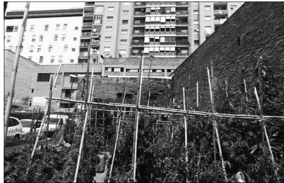
Els Guillén conreen actualment un hort al costat d'on hi havia la granja

El futur de l'edifici i terreny de la granja Guillén és incert. L'Ajuntament, a través