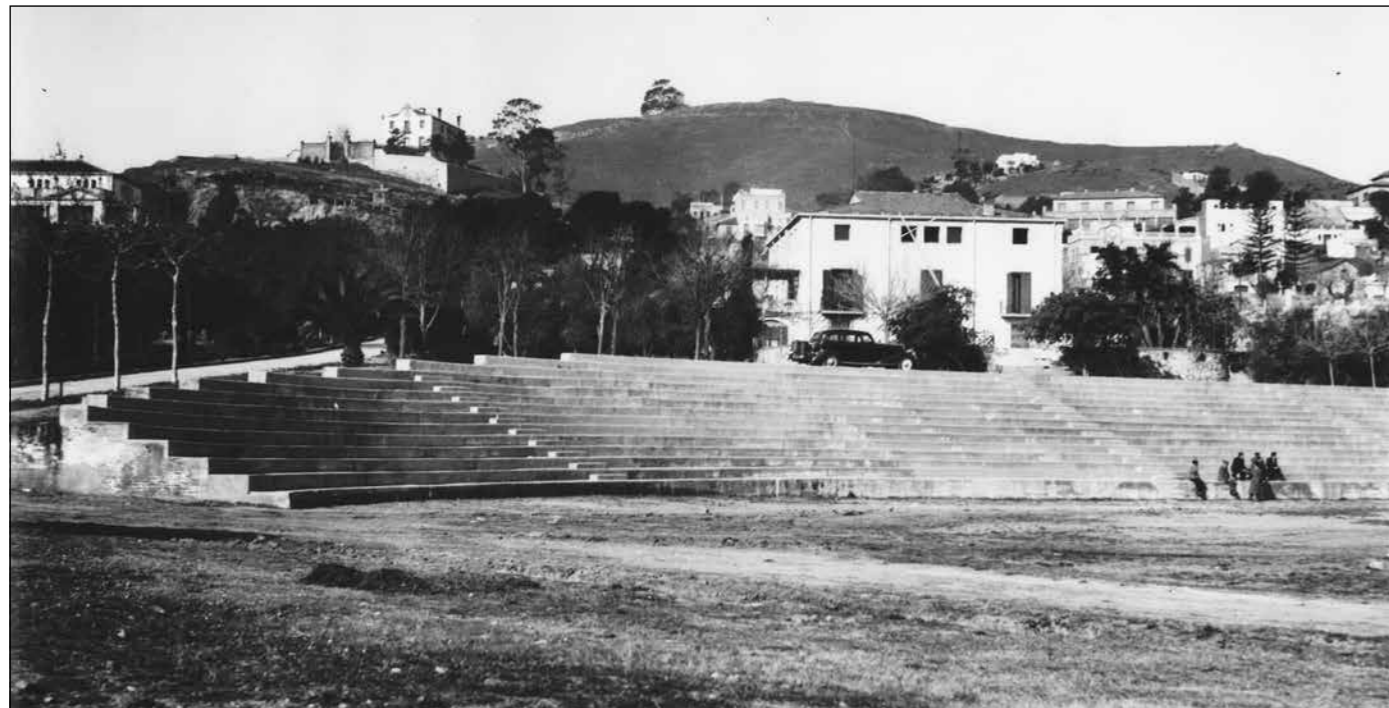
Can Mèlic o can Planàs amb la graderia del Canòdrom a primer terme en una foto de mitjans dels anys quaranta

Tenien una masia al Guinardó que el 1982 es va convertir en Centre Cívic