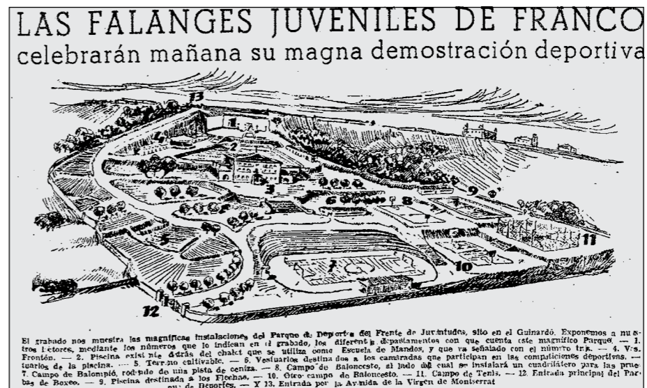
Dibuix aproximat de la finca de can Planàs quan era ocupada per la Falange