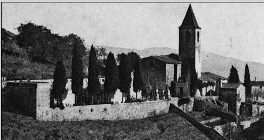
El cementiri parroquial i l'església a començaments del segle XX

El cementiri de Sant Genís, junt amb el de Vallvidrera, són els dos únics fossars parroquials que continuen avui vigents. En l'actualitat el cementiri de Sant Genís és gestionat de forma privada per una Junta Administrativa formada pel Bisbat de Barcelona i la parròquia de Sant Genís. Anualment, al voltant de la festa de Tots Sants, es convoca una reunió amb els titulars de les sepultures per dirimir les qüestions relatives a la gestió i el manteniment de la instal·lació. Hi ha un total de 1091 sepultures