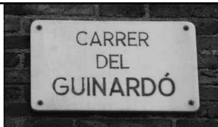
Placa del carrer Guinardó

Torre Vèlez del 26 al 40 / Sant Quintí del 90 al 100 / passatge Garcia Cambra del 2 al 16. Tota una illa de casetes construïdes el 1929, que han arribat fins els nostres dies en un estat de conservació notable. Al barri hi ha dos altres grups de cases de la Cooperativa que segueixen el mateix model archi-