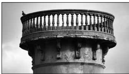
Torre mirador del carrer de la Puríssima