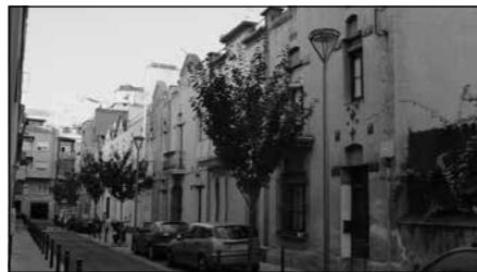
Cases de la Cooperativa militar

tectònic: al passatge Tinent Costa (entre els carrers Segle XX i Torre dels Pardals), ben conservades, i a la Travessera de Gràcia, tocant a Cartagena (un grup totalment deteriorat). Catalogades a nivell C.