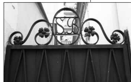
Detall amb l'any de la casa Gruart. A sota, passadís de la casa Boloix