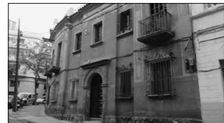
El xamfrà arrodonit de les cases d'en "Santa"

projecte d'Enllaços afectà ben aviat aquesta part del Guinardó.