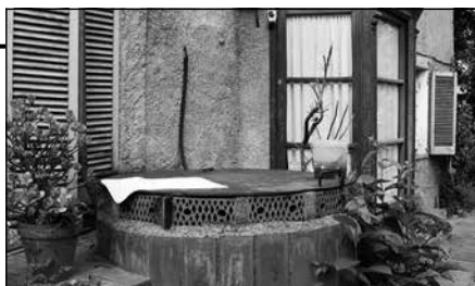
Pou de cal Senyorito

Carrer molt estret urbanitzat arran de l'aixecament d'edificis d'autoconstrucció per part dels veïns que van comprar les parcel·les de terrenys de ca n'Oriol cap els anys cinquanta-seixanta. En aquest procés d'autoconstrucció cada propietari edificava segons les seves possibilitats i capacitats.