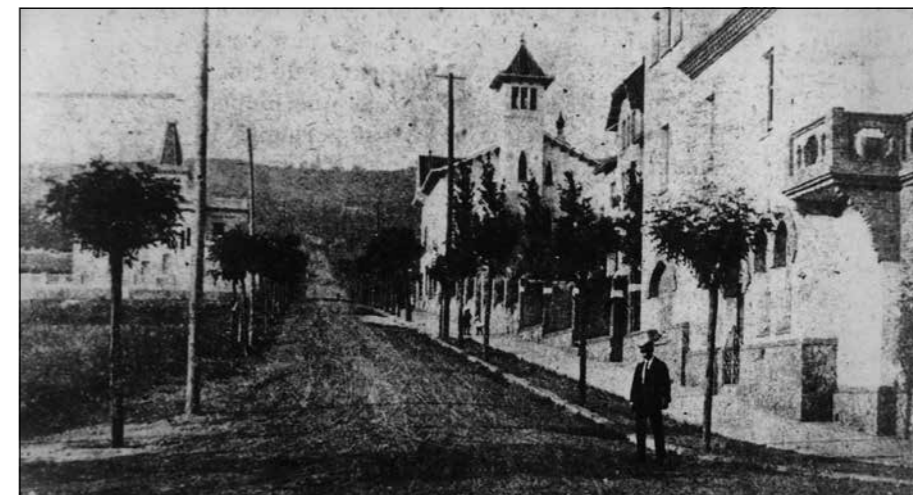
Pg. Font d'en Fargues (1910). Dreta: can Giol i cases núm. 8 i 10. Esquerra: casa núm. 15

■ Els Fabrè van edificar per a diferents membres de la família, tres torres amb els corresponents jardins, aquesta, una altra