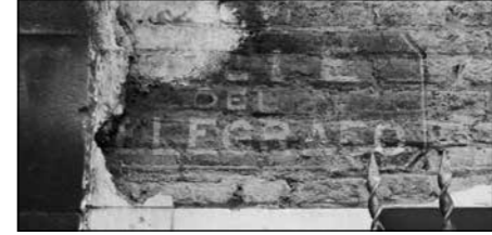
Rètol antic amb el nom del carrer Telègraf

Telegraf, 24 . A la paret de la casa quasi enderrocada s'hi pot llegir, pintat en blau, el nom del carrer. Aquesta zona, al llarg dels anys ha patit moltes modificacions causades pel projecte i l'execució del Primer Cinturó de Ronda. De l'antic urbanisme, queda el carrer de Juliol. Han desaparegut un carrer paral·lel a Juliol que es deia Florit i un altre anomenat Gràcia (posteriorment Antonio M. Quadrado). El