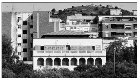
Ca n'Andalet i el turó de la Rovira

Així, hi ha cases de planta més pis i d'altres que s'alcen fins a tres plantes.