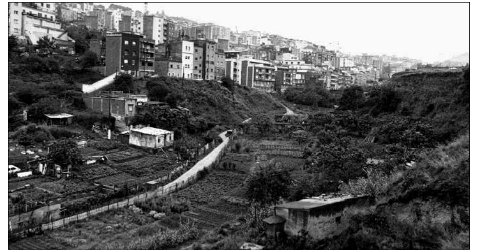
Conjunt d'hortos que hi havia el 1988 per on ara passa el carrer de Lisboa

El primer marqués de Castellbell (1670-1715), que va defensar la ciutat el 1697, era propietari d'extenses finques a la contrada. Sobre terrenys propietat dels familiars hereus es van segregar parcel·les de 6 x 20 m.