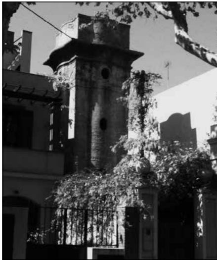
Torre de subministrament d'aigua de la mina de can Cortada (carrer Campoamor)

Graner i Prat - construïda entre 1916 i 1918 - Nivell de protecció C. Des de 1974 acull el Centre d'educació especial Carrilet.