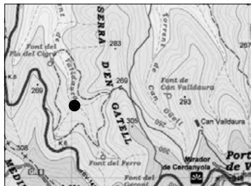
Situació de les restes de Valldaura a Collserola