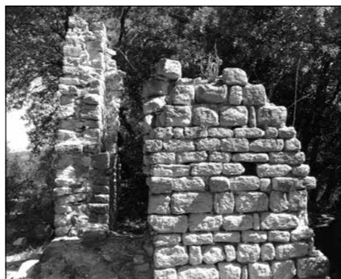
Dues imatges de la granja d'Ancosa (Anoia)