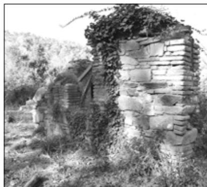
Murs aixecats amb elements reutilitzats