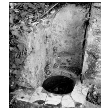
Sifó d'entrada d'aigua