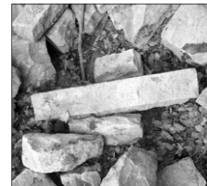
Carreus escampats a terra