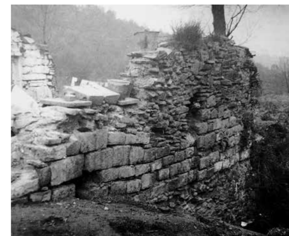
Ruïnes de Valldaura el 1967