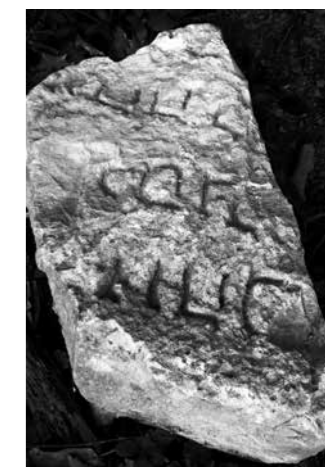
Pedra amb inscripcions