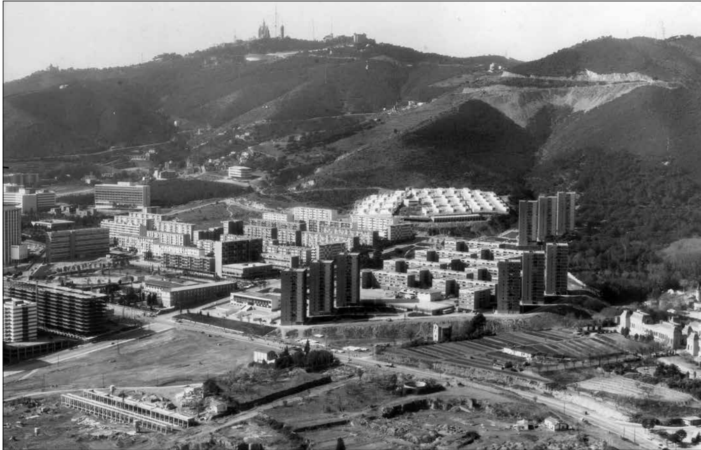
La urbanització de Montbau ja estan acabada, però el passeig de la Vall d'Hebron encara està per fer