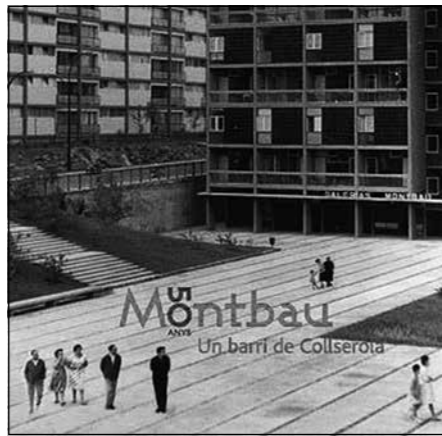
El text d'aquest reportatge està basat en el llibre de Carlota Giménez Compte: Montbau 50 anys, Un barri de Collserola , Ajuntament de Barcelona – Districte Horta-Guinardó, Barcelona, 2011

socials, geogràfics i econòmics, va haver d'aprendre a conviure i a trobar solucions que no els venien donades per una administració en ple franquisme. Es van crear cooperatives de consum: La Puntual; escoles: la més emblemàtica l'escola Baloo; una