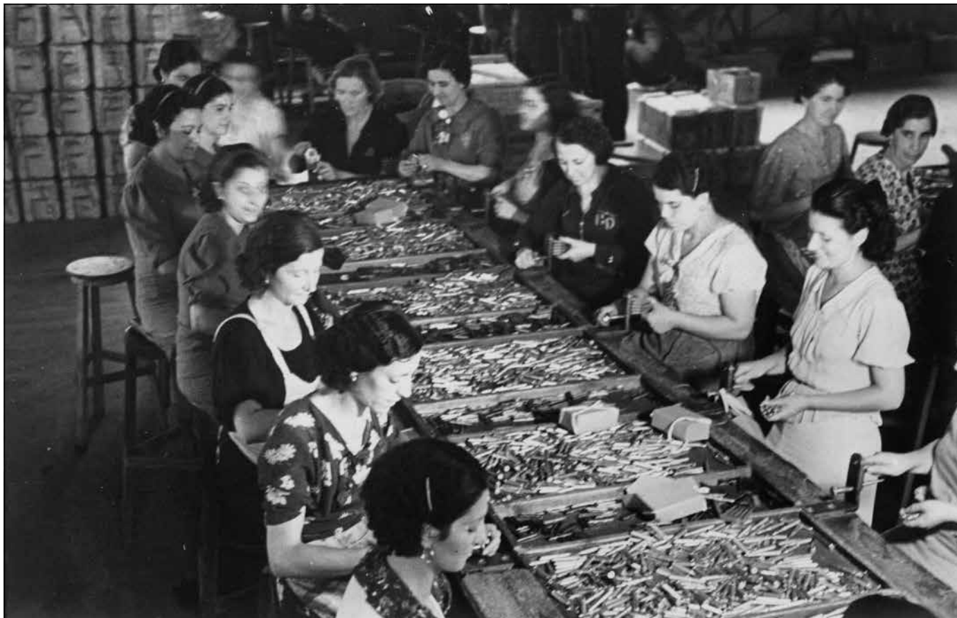
1937 - Treballadores muntant pintes de cartuxos a la Fàbrica 7