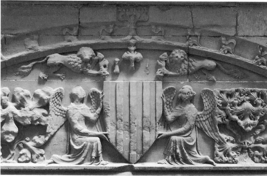
Fig. 5. Escut reial a les escales del pati major (Fot. J. Yarza).

de l'abat Porta i començat a ampliar per ell mateix a l'entorn de la data en què Bronseval visità el monestir. 41