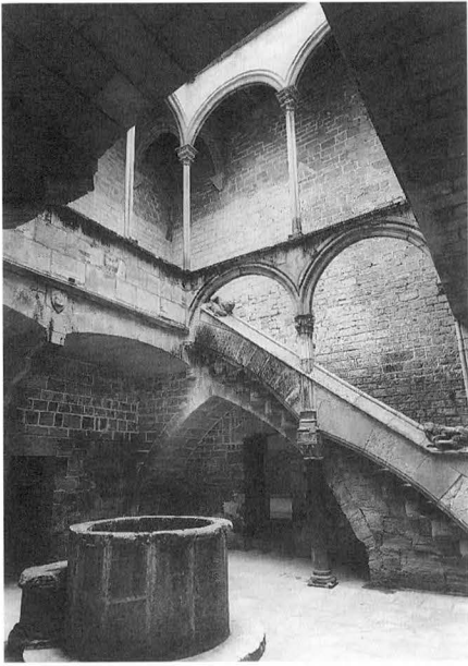
Fig. 1. Santes Creus. Pati major del Palau Abacial (Barcelona, Arxiu Mas).

tes al primer pis del pati principal. Figurava igualment a les rajoles que van haver-hi a la planta baixa del primer pati, segons que informen Teodor Creus i B. Bassegoda. 2 Aquest conjunt d'emblemes, entre els quals n'hi ha de reials i d'abacials, s'ha emprat tradicionalment com a mitjà per a la datació de l'edifici, tot i que no hi ha total coincidència entre els estudiosos pel que fa a la seva identificació. Mentre que, en uns casos, s'ha privilegiat una lectura dels signes heràldics en relació amb personatges històrics concrets, en d'altres, la interpretació ha estat de caire més genèric. Així, per exemple, Bonaventura Bassegoda 3 es decanta per considerar els escuts que figuren al costat dels pals d'Aragó