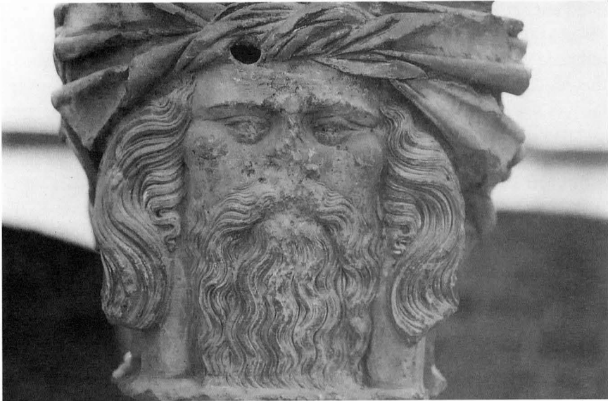
Fig. 3. Cap masculí. Detall del capitell emplaçat a l'esquerra de l'escala del pati major del palau dels abats.

des del vestíbul al primer pis [Fig. 3], 29 però, si les nostres sospites a propòsit de la incorporació de la columna de pòfir en aquest indret són encertades, això s'esdevingué cap al 1375 i la presència documentada del piquer francès data del 1388. Per ara, sense cap altra base documental, seria agorarat pretendre que es tracta del mateix artífex.