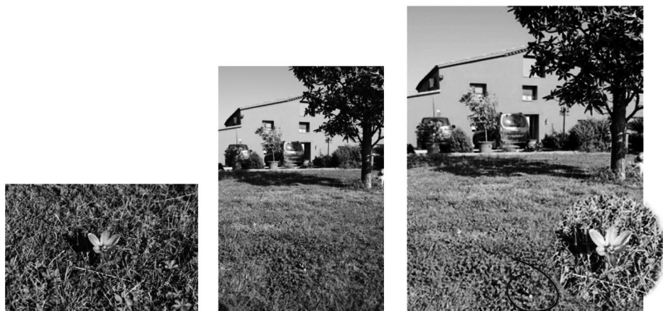
Figura 3 Una flor de safrà a can Pou de Riudellots de la Selva