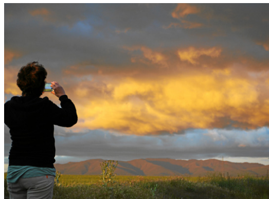
Fig.3. La fotografía de las nubes es una actividad fascinante que mejora las destrezas de observación y clasificación de los estudiantes.

Las pautas básicas para documentar cada una de las fotografías se basan en la ficha de la Unidad didáctica “cazadores de nubes” (Martín León y Qui-