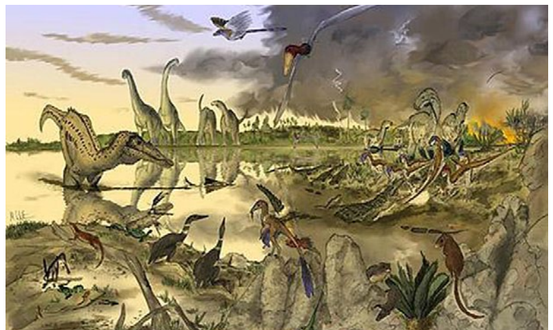
Fig. 2 Reconstrucción paleoecológica ilustrando la presencia de dinosaurios (en http://www.telegraph.co.uk/science/science-news/7499113/Dinosaurs-came-to-rule-world-after-mass-extinction.html )

El ítem 7 permitió localizar algunas contradicciones entre las ilustraciones y el texto donde cabe destacar la introducción de reconstrucciones paleoecológicas con dinosaurios sin haber sido definido el concepto en el libro. La reconstrucción, además de dinosaurios, suele incluir otros grupos de animales coetáneos como reptiles voladores o mamíferos con pies de figura que solamente hacen mención -de forma específica- a los dinosaurios (Fig. 2).