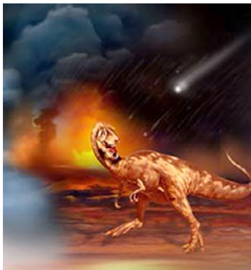
Fig. 4 Imagen asociada a la extinción de los dinosaurios como un evento catastrófico. (en http://www.lpi.usra.edu/features/speakerseries/rogue_asteroid/ )

Finalmente, el análisis cuantitativo consistió en someter el texto transcrito de los 42 libros con contenidos sobre el concepto dinosaurio a un análisis de frecuencias, con el fin de obtener un listado de los vocablos más comunes relacionados con el concepto, ordenados en función de su índice de repetición. Al margen del propio término dinosaurio (en singular o plural) que aparece en 295 ocasiones, los