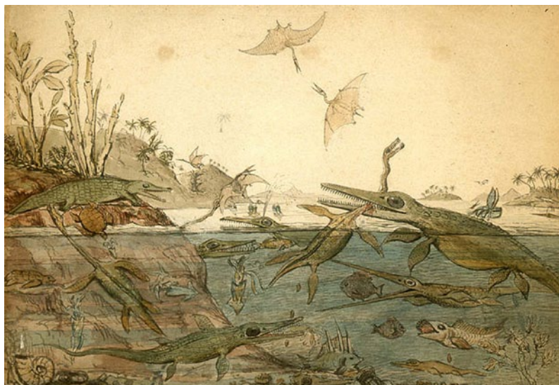
Fig. 3. Duria antiquior realizada en 1830 por el geólogo inglés Henry de la Beche.

Incluso en algunas de estas reconstrucciones (Fig. 2) se observan analogías con obras del siglo XIX (Fig. 3) que proyectaban una visión victoriana de la vida en el pasado remoto con una aglutinación artificial de “monstruos” heredera del principio medieval de plenitud, enteramente ocupados en una feroz competición por la existencia (Barberá, 2009).