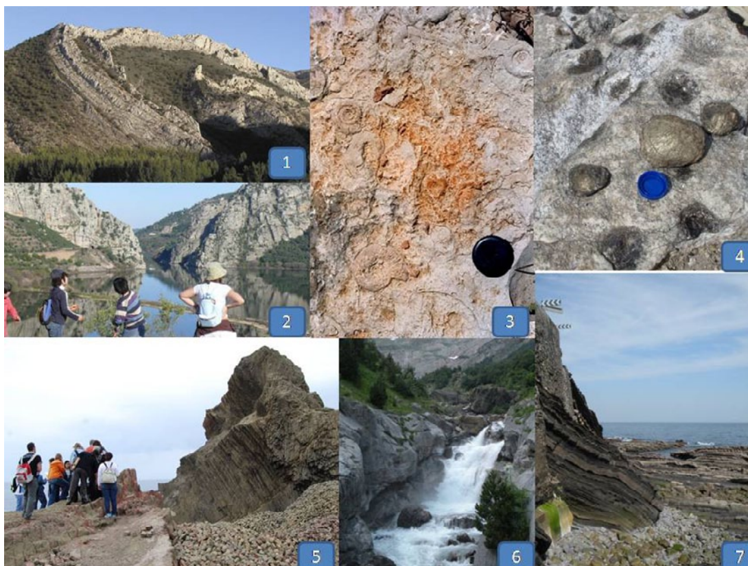
Fig. 4. Algunos rasgos geológicos de los siete geoparques que actualmente existen en la Península Ibérica: (1) Pliegue de la Olla en Aliaga (Maestrazgo; foto: J.L. Simón); (2) Monumento Natural "Portas de Ródão" (Naturtejo; foto: HYPERLINK " http://www.geoparquearouca.com " M.M. Catana); (3) Afloramiento de ammonites (Subbéticas; foto: P. Alfaro); (4) Granito nodular de Castanheira "Pedras Parideiras" (Arouca; foto: HYPERLINK " http://www.geoparquearouca.com " M.M. Catana); (5) Disyunciones columnares (Cabo de Gata; foto: P. Alfaro); (6) Valle de Pineta (Sobrarbe; foto: J. Poch) y (7) Flysch Negro de Mutriku (Costa Vasca; foto: J. Poch).

Gradualmente se van desarrollando programas didácticos acordes con las competencias básicas de los programas de educación primaria y secundaria de cada país, valorando especialmente las salidas de campo en su triple dimensión: conceptos, procedimientos y actitudes (García de la Torre, 1991; Brusi, 1992). Se considera que las salidas de campo tienen un valor especial para desarrollar las