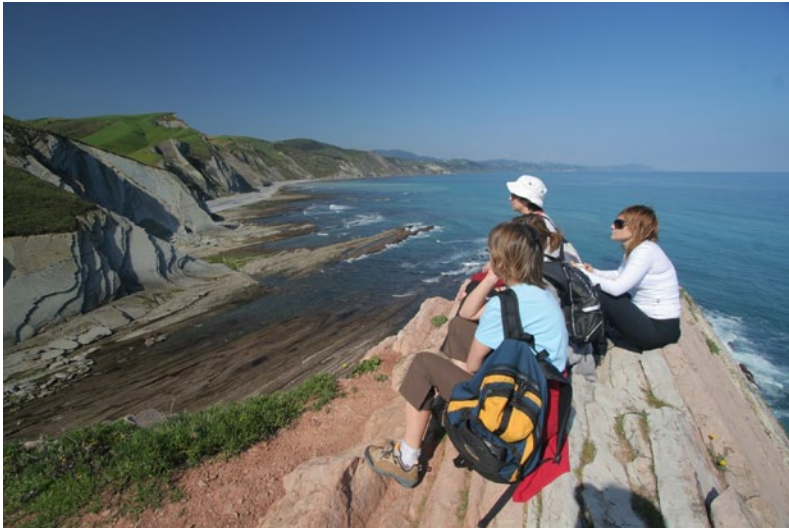
Fig. 5. Actividades educativas de geología en el Geoparque de la Costa Vasca (Guipúzcoa, España).

competencias emocionales. No en vano, una de los principales objetivos del geoparque es reforzar el sentido de pertenencia de los habitantes hacia su territorio.