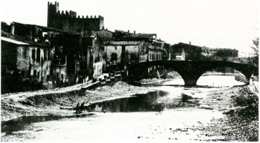
Fig. 1. El castell era l'element defensiu més important de la vila de la Bisbal, sobretot quan encara no s'havien bastit les muralles. Al punt més alt del castell un vassall del bisbe estava obligat a fer bada o vigilància per alertar la població en cas que s'acostessin tropes enemigues. Foto 1: Enric Riera. Col·lecció de l'autor.

no tenia l'obligació d'indemnitzar la família de l'improvisat guerrer quan aquest moria o era ferit al camp de batalla.