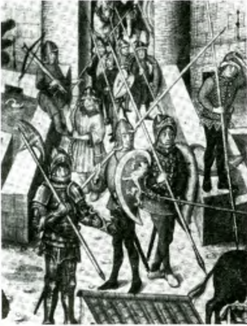
Fig. 2. Guerrers catalans, segons un retaule del segle XV, equipats amb llança i escut. A l'esquerra, a primer terme, un cavaller amb la seva armadura; a segon terme, assegut a la barana del pont, hi veiem un ballester.

las covinences qui eren entre lo senyor bisbe de Gerona e la noble senyora Margarida de Cruyles tenent e possehint per certs titols e drets lo castell de Cruyles son revocades en axí que d.aqui avant no y ha covinences entre los dits senyor e senyora. 2 Aquesta crida fa entendre implícitament que a partir d'aleshores els bisbalencs han d'estar a l'aguait dels possibles atacs o agressions de la gent de Cruilles.