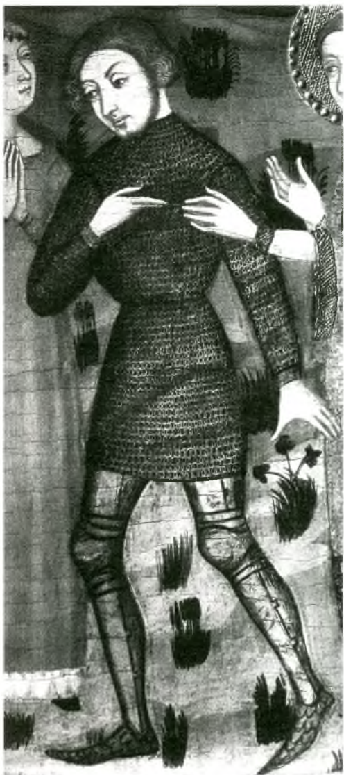
Fig. 7. Un cavaller, segons un retaule del segle XIV, amb la cota de malla que portaven sota l'armadura i l'arnès de les cames i cuixes.

Uns gossets de llauna o protecció de malla per a les aixelles guarnit amb roba de cotó negre.