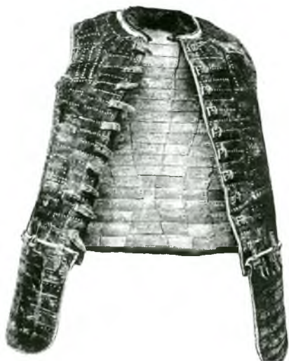
Fig. 3. Cuirassa (com la que devien tenir els membres del sometent de la Bisbal) de roba amb làmines de llauna de ferro imbricades. Aquesta figura i les restants corresponen a armes recollides en el llibre L'arnès del cavaller. Armes i armadures catalanes medievals , de Martí de Riquer.

mantenir-se cadascú, si el setge s'allargava.