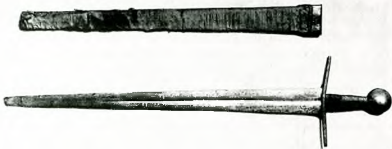
Fig.4. Espasa catalana del segle XV. amb la seva beina, l'arma més comuna en les lluites cos a cos.

Aquesta infanteria bisbalenca, força ben armada, s'organitzava en grups de 10 homes, anomenats cadascun dehena (desena) i comandats per un dehener (desener). No sabem com es distribuïen les armes a cada desena, però sí que ens consta que cadascuna havia de tenir quatre ballesters. Tots calia que estiguessin a punt ( apareyats ) i acudir amb les armes quan sentien el toc de corn des del Castell. Prèviament, se'ls avisava per mitjà d'un pregó. I així ho veiem en aquest del 21 de juny del 1376: " Ara oiats tothom que us fa saber la Cort de part del senyor bisba que tothom estiga aparayat ab totes ses armes e sia asi en continent que el corn huiran sots pena de cent sous. Item en quant que tot dehener fas portar en la sua dehena quatre ballestas sots la dita pena. " 7