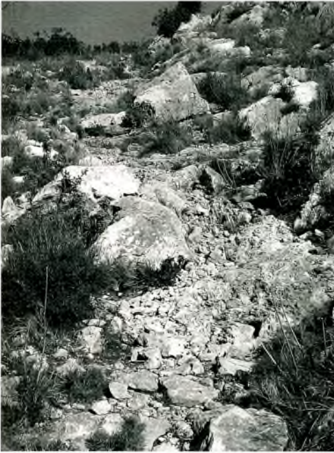
El coll d'en Garrigàs

sector on localitzem la totalitat dels noms que presentem.