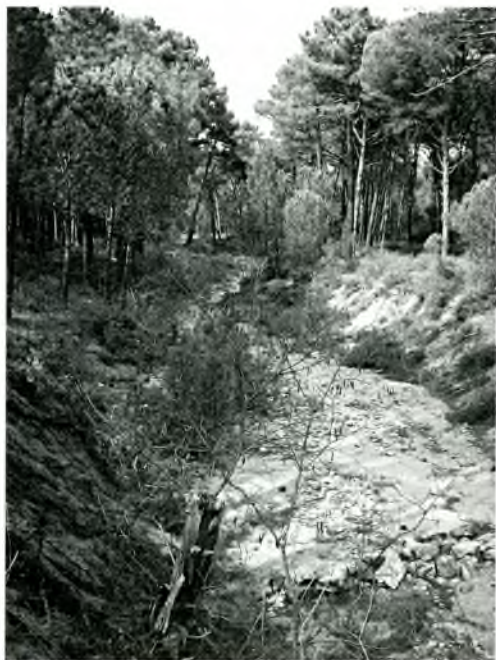
El còrrec de Comallobera