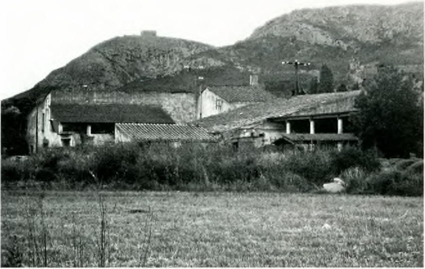
El Mas Marquès

La quarta torre que anotem és la torre del portal d'Ullà (“lo camp de la torre del portal de ulla” (AHTM, Cadastre 1716, 141v), que es refereix al portal d'Ullà .