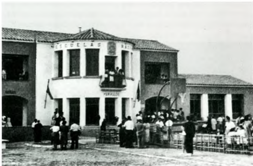
6- L'Escola Ntra. Sra. de las Mercedes quan fou inaugurada l'any 1957