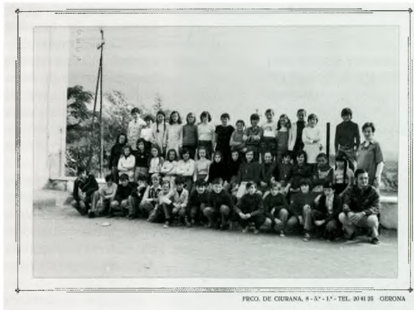
10 – Grup escolar de nens i nenes de Calonge l'any 1975 (AMC)

D'altra banda, el dia 2 de juliol de 1973 el Ple de l'Ajuntament posava nom oficial al Grup Escolar d'EGB de Calonge: