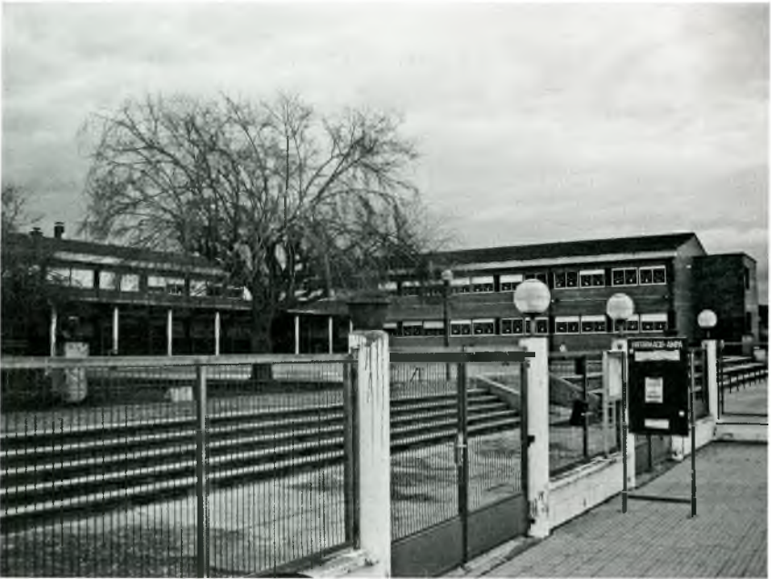
16 - L'Escola Pere Rosselló actualment, any 2009

I els mestres reben els reforços següents: 1 especialista de música