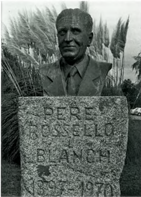
20- Bust de Pere Rosselló, obra de l'escultor Antoni Delgado, que presideix el grup escolar inaugurat l'any 1983

Para terminar una palabra de felicitación sincera a todos vosotros invitados, vecinos y asistentes, por acompañarnos en este acto y día de gratísimo recuerdo para Calonge y un ruego de que manifestéis vuestra adhesión a los sentimientos que humildemente acabo de expresar dedicando un fervoroso aplauso a nuestras autoridades provinciales y, en particular, al Excmo. Sr. Ministro de Educación Nacional. He dicho.”