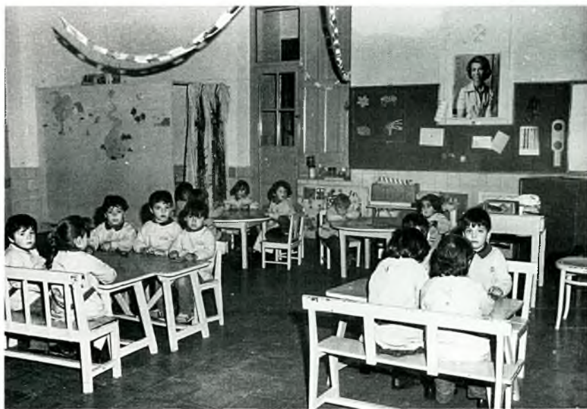
14- Grup d'infants de la guarderia La Palmera a l'antic planxador de les germanes (1982)