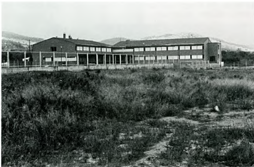
15 – El nou Grup Escolar Pere Rosselló l'any 1983