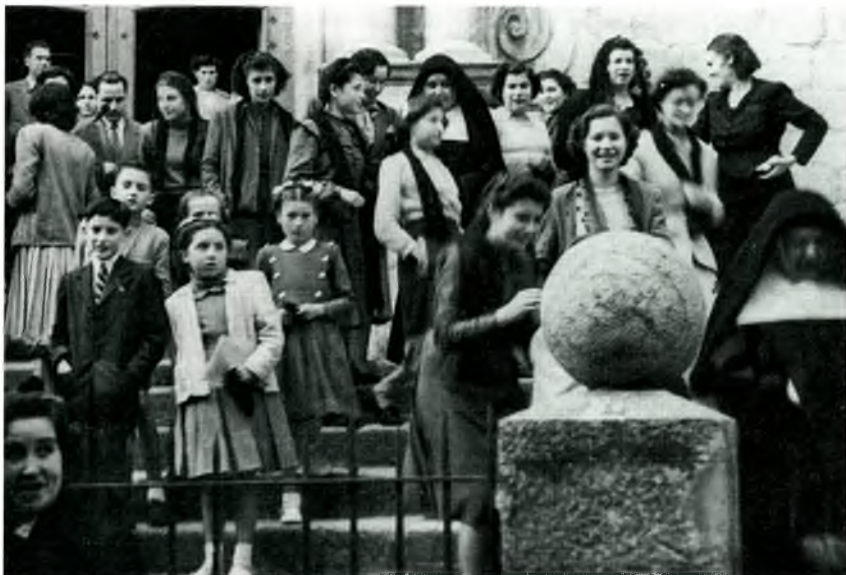
9- Sortida de missa. Les carmelites vesteixen el mateix hàbit que usà santa Joaquina de Vedruna, la fundadora

también a veces en los días festivos, los pequeños de las madres que van al trabajo todo el día. Esto acontece sobre todo en los meses veraniegos. (...) Acogen -sin que tenga internado- a las niñas que tienen padres trabajando en el extranjero o que están hospitalizados (comen y duermen en el mismo colegio) en el que se hicieron obras apropiadas, en parte sufragadas por el Ayuntamiento vista la labor de la Comunidad. Los domingos y festivos visitan a enfermos de la parroquia y a matrimonios ancianos (...) a quienes realizan servicios domésticos y sanitarios. " 19