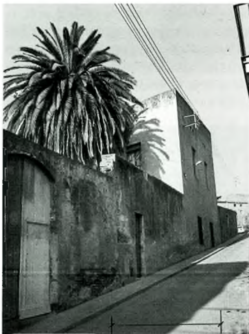
13 - La palmera que donà nom a la guarderia, vista des del carrer Anselm Clavé (1982)