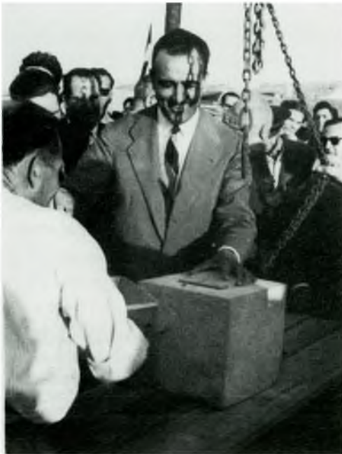
4 - El ministre d'Educació, Sr. Joaquin Ruiz-Giménez, el dia 12 de setembre de 1955 col·loca la primera pedra del Centre Escolar Nuestra Sra. de las Mercedes

"Primero.- Aprobar en todas sus partes las cuestiones llevadas a cabo por la Presidencia, y en su consecuencia, adquirir por compra, por la cantidad de ochenta mil pesetas dos vesanas de terreno propiedad de Don Damián Ferrer Sayeras, con destino de emplazamiento de las escuelas unitarias y parvularios en el barrio de San Antonio.