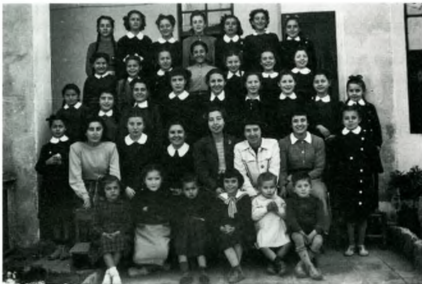
3- Grup d'alumnes de les carmelites en els anys cinquanta. Les exalumnes (segona fila) hi anaven a fer labor .

cuelas Nacionales y escuelas de las Carmelitas. Las primeras estan regentadas por 2 maestros y las últimas por 5 religiosas. En preferencia, el Colegio de las R.R. Carmelitas contribuye muchísimo más en todas las cosas parroquiales y públicamente se les reconoce una neta superioridad en todos los conceptos”. 8