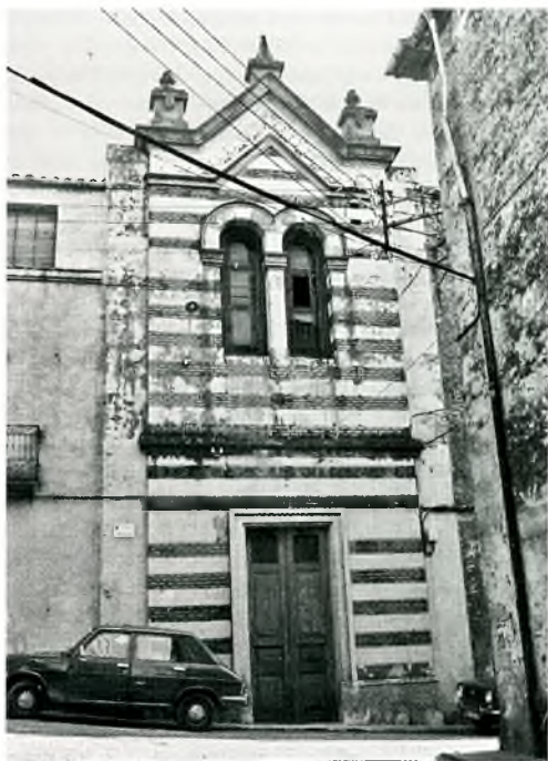
19- Estat actual de la façana de l'església del Carme que necessita una urgent restauració