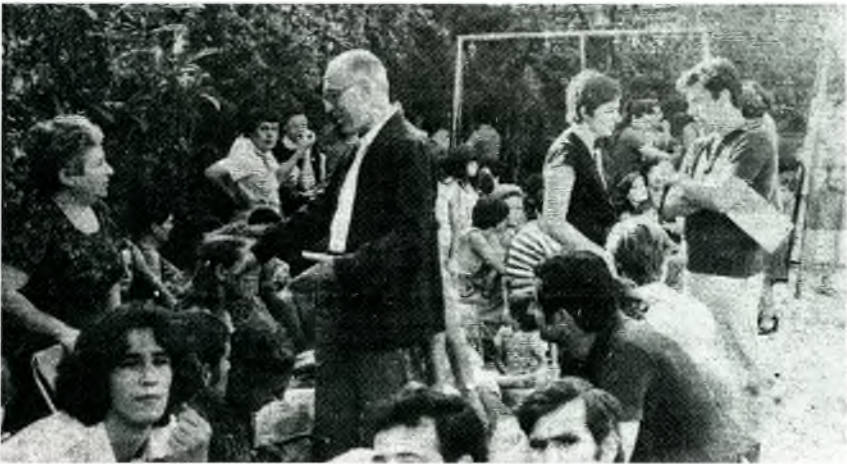
12- Fotografia de l'ocupació pacífica del col·legi (setembre 1979)