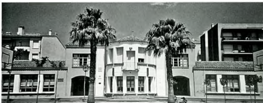
17- L'Escola Mare de Déu de la Mercè actualment, any 2009 Arxiu CEIP La Mercè)