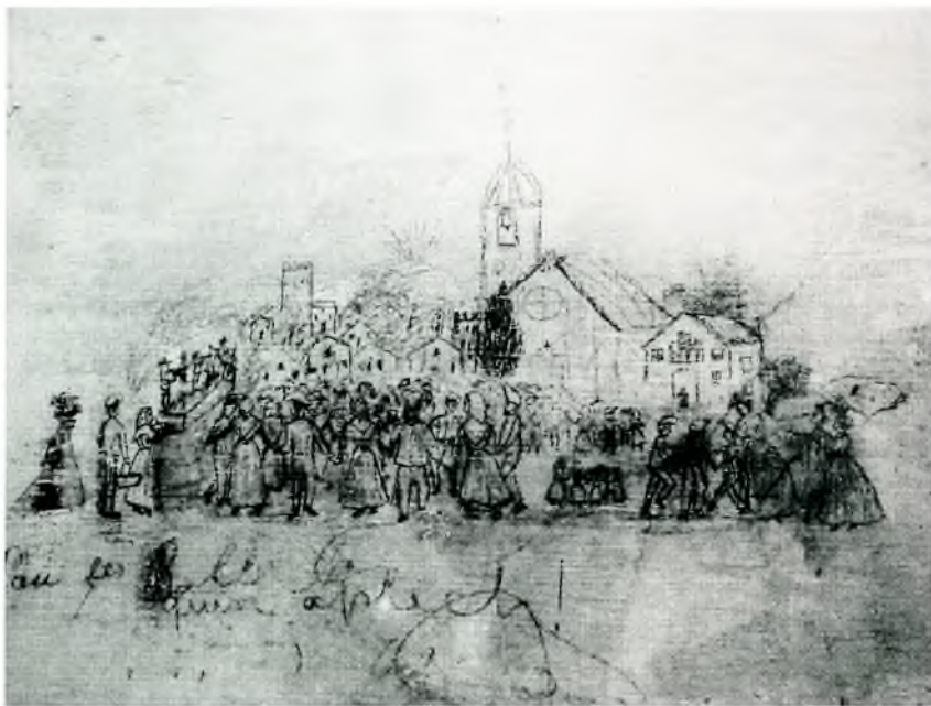
Fig. 1. Un poble de Llofriu idealitzat, de festa, amb els seus habitants ballant sardanes, llapis sobre guix, a les parets de la casa de can Bassa, a Llofriu, a principis del segle XX.

Aquest, juntament amb la imatge del poble de Llofriu de l'aplec de sardanes, on el moviment és també molt present amb els diversos personatges, que ballen i passegen pel poble, són dos dels apunts més ben aconseguits i molt probablement van estar realitzats per la mateixa persona. Curiosament tots aquests esbossos es troben concentrats en una mateixa estança, es podria tractar d'una cambra d'estudi, i la majoria d'apunts són caricatures, retrats d'alguns dels membres de la família com el de la Montserrat Bassa Rocas, o bé gent propera a la vida quotidiana dels Bassa Rocas, com la senyora Catalina Bofill, i el mateix ciclista Lluís Reig i Sagrera. Ens imaginem que aquests dibuixos van començar com un joc d'infants, però avui ens han conduït a voler conèixer aspectes de la vida d'aquells que els van fer, en concret, a saber més de la vida del fill que va optar clarament per una via artística.