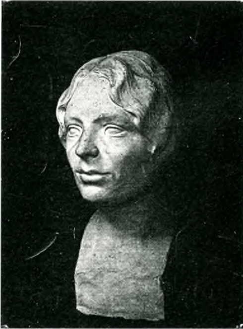
Fig.5. Bust de gitana , 1911, escultura en pedra, reproduïda en una fotografia de l'època.

també a través de fotografies de l'època que el mateix Serafí realitzava per enviar a la seva germana i tenir-la al dia de la seva producció artística i corresponen entre els anys 1911 i 1913, i es tracta de bustos, i figures de cos sencer, de personatges extrets del seu entorn quotidià; ell no va a la recerca d'uns models ideals, sinó que la seva font d'inspiració prové de la realitat quotidiana.