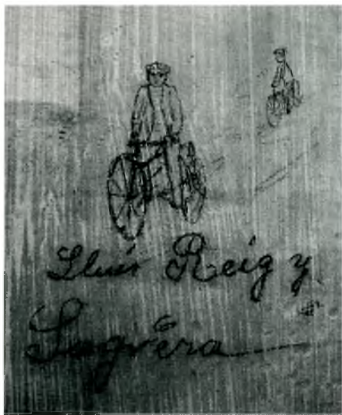
Fig. 2. El ciclista, Lluís Reig i Sagrera, en dos moments del seu passeig, llapis sobre guix, a les parets de la casa de can Bassa, a Llofriu, a principis del segle XX.

el fill, Berga i Boada, tal com ho testimonien els diaris de la Irene Rocas i la correspondència que existeix entre els dos personatges, des del 1907 2 ; podríem afirmar que no perdran el contacte, fins que la salut de Bassa es deteriori. El curs 1908-1909, va ser el seu germà, en Lluís, qui va estar matriculat a l'Escola de Belles Arts d'Olot, i per la mateixa Irene, sabem que l'any anterior, "Les petites anaven a l'escola i tots, (.), grans i petits, a dibuix amb els Bergas pare i fill. En Serafí aprenia l'escultura i en Lluís (al cel sia) de manyà mecànic i n'