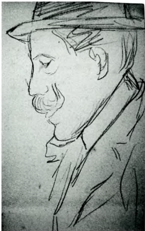
Fig. 3, Retrat de personatge, llapis sobre paper, dibuix pertanyent a un bloc de dibuixos. Arxiu Municipal de Palafrugell, Fons Família Bassa Rocas.

Aquests seran els anys més prolífics per a Serafi Bassa, s'ha conservat un petit quadern d'anotacions i dibuixos del nostre artista, on apareixen part dels apunts presos a la seva estada a Olot l'estiu del 1907, entre ells un retrat de perfil d'un personatge, del qual no coneixem la identitat, però que molt probablement es tractava d'algú proper al seu entorn quotidià a Olot. (fig. 3). En el mateix quadern es succeeixen imatges del Baix Empordà, com l'ermita de Mont-ras del 1909, per passar a un seguit de dibuixos dels edificis modernistes més representatius de la ciutat de Barcelona, com la torre del parc Güell, o bé l'edifici de la Sagrada Família en construcció (fig. 4), aquest