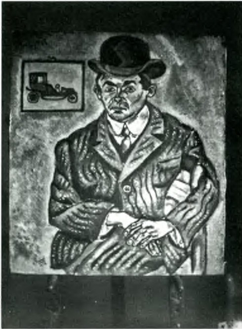
Fig. 7; Fotografia, del quadre de Joan Miró, retrat d'Heribert Cassany del 1918, realitzada molt probablement en el mateix taller del pintor, que Serafí Bassa devia visitar acompanyat de Llorens Artigas. Atribuïda a Serafí Bassa. Arxiu Municipal de Palafrugell. Fons Família Bassa Rocas.

tes dues obres estiguin reposant en un cavallet ens indica que molt probablement van ser fotografiades en el taller 16 de Miró de Barcelona que compartia amb un altre artista, el seu amic Enric. C. Ricart. En aquells moments Miró forma part de l'agrupació "Courbet", fundada pel seu amic Llorens Artigas 17 , íntim amic també de Serafí Bassa, el seu antic soci del taller Canigó , i gairebé segur que és a través de Llorens Artigas, que Serafí pot efectuar aquestes fotografies de la darrera producció de Miró. Així hem de deduir que Bassa va conèixer alguns dels membres de l'Agrupació Courbet, entre