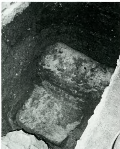
Fig. 6. Imatge de conjunt de la cupa amb el paviment de morter que s'estenia als seus peus.

sobretot, deixar l'excavació de la sepultura per a algun moment futur en què les circumstàncies siguin més favorables per excavar-la completament.