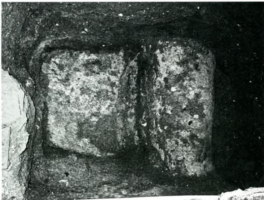
Fig. 7. La cupa vista des de dalt.

recorda mitja bóta. 1 Aquesta forma, tanmateix, anà evolucionant i canviant per adquirir un aspecte més prismàtic, troncocònic o troncopiramidal.