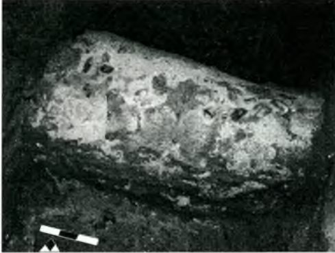
Fig. 5. La cupa en el transcurs de l'excavació del sector I.

tercera fossa situada a la banda nord-occidental, en la qual es documentà un cos incomplet. I encara es localitzà un quart retall, en part sota d'un dels primers esmentats, que contenia un altre cadàver, si bé en molt mal estat de conservació.