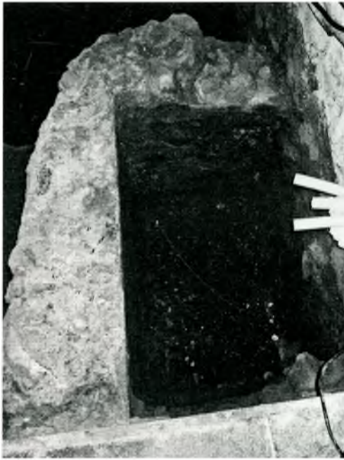
Fig. 4. Tomba múltiple del sector 2.

havia a l'entorn de l'església del monestir benedictí, obertes des d'època medieval. El terreny on estaven excavades, pel que sembla, patí una profunda transformació als segles XVI-XVII quan es bastí la tomba d'obra adossada al mur de la capella septentrional del transsepte, la construcció de la qual assenyala un alçament notable del nivell de circulació de la zona que s'aconseguí amb l'abocament d'una gran quantitat de terra. Com evidencien les nombroses restes òssies humanes, hom emprà la terra que