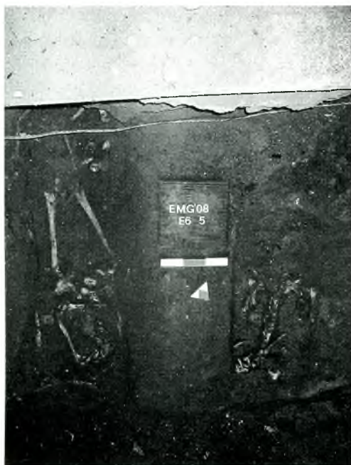
Fig. 3. Dues de les cinc inhumacions modernes localitzades al sector 2.

poc més avall del punt on la banquetta de fonamentació de la torre quedava penjant, sorgí un estrat de sorra fina i començà a eixir aigua, la qual cosa indicava la proximitat de la capa freàtica i, per tant, la profunditat màxima que podia assolir l'excavació del sector 2.