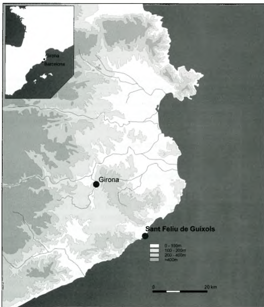
Fig. 1. Situació del municipi de Sant Feliu de Guíxols.

El sector 2, el més grans dels dos, s'obrí a la capella situada immediatament a llevant de la porta, de planta rectangular i amb unes dimensions de 4,65 m per 3,2 m. Per l'est limita amb la paret de l'absis septentrional del transsepte, que per l'exterior ofereix un aspecte de torre fortificada car, de fet, en època medieval formava part del sistema defensiu del monestir (era l'anomenada torre de Tramuntana o dels Reis). La solidesa d'aquesta estructura queda ben testimoniada per la fonamentació, que s'enfonsa fins a 2,4 m