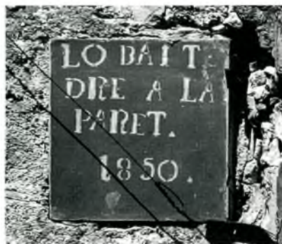
Fig. 2. Palafrugell. C. de la Font, 13, a mitgera amb l'11