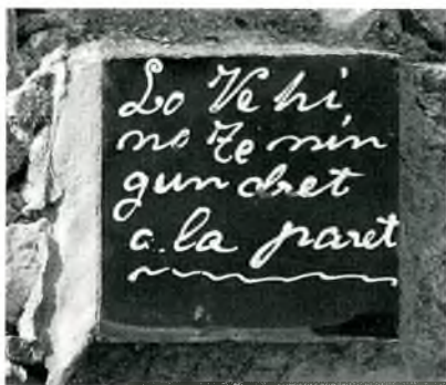
Fig. 6. Palafrugell. C. Estrella, 6, a mitgera amb el 4