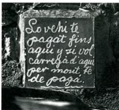
Fig. 10. Palafrugell. C. Girona, 67, a mitgera amb el 65