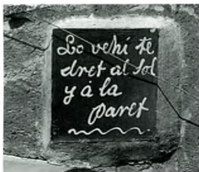
Fig. 1. Palafrugell. C. Torroella, 103, a mitgera amb el 101