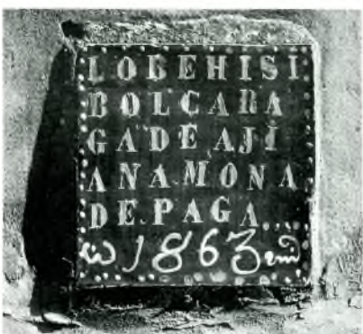
Fig. 11. Palafrugell. C. de les Botines, 24, a tanca amb Progrés, 13