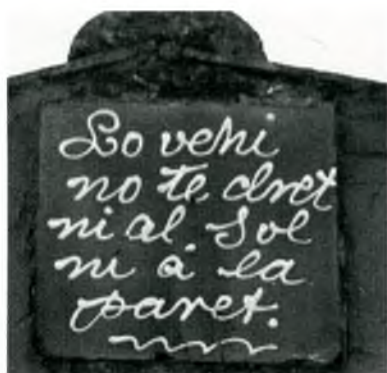
Fig. 5. Mont-ras. Av. Catalunya, 9. Destruïda l'any 2006.