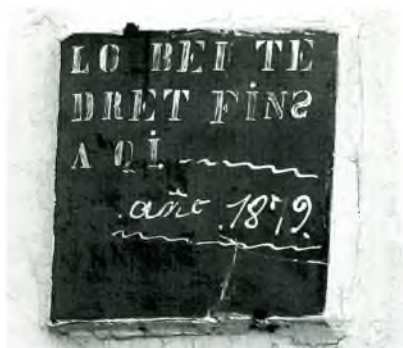
Fig. 7. C. Sant Pere, 67, a mitgera amb el 65