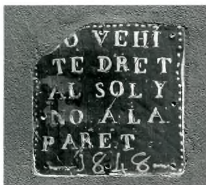
Fig. 4. Palafrugell. C. de les Ànimes, 12, a mitgera amb el 14