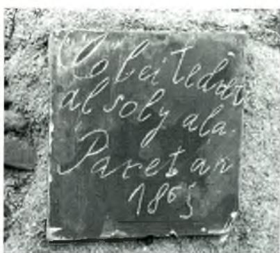
Fig. 9. Calella. C. Lladó, 5, a mitgera amb el 3. Desapareguda