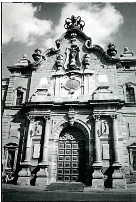
Foto núm. 9: A l'antiga Universitat de Cervera el 3 de febrer de 2006 es celebrà una assemblea amb el lema: "La terra, un bé a protegir".

es, i el medi natural, i reconduir aquesta atracció del món urbà cap al món rural 46 .