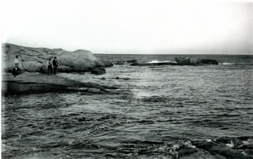
Foto núm. 2: Roques Planes cap al 1900. Reculant a la baixa edat mitjana, Trochmal era una possessió de la Pabordia de Juliol de la Catedral de Girona.

a) L'any 1314, un alou situat a Calonge, pertanyia un 50% al noble Berenguer de Cruïlles, i l'altre 50% al rector de l'altar de Sant Benet, fundada a la catedral de Girona, si bé les rendes, les percebia Berenguer de Cruïlles.