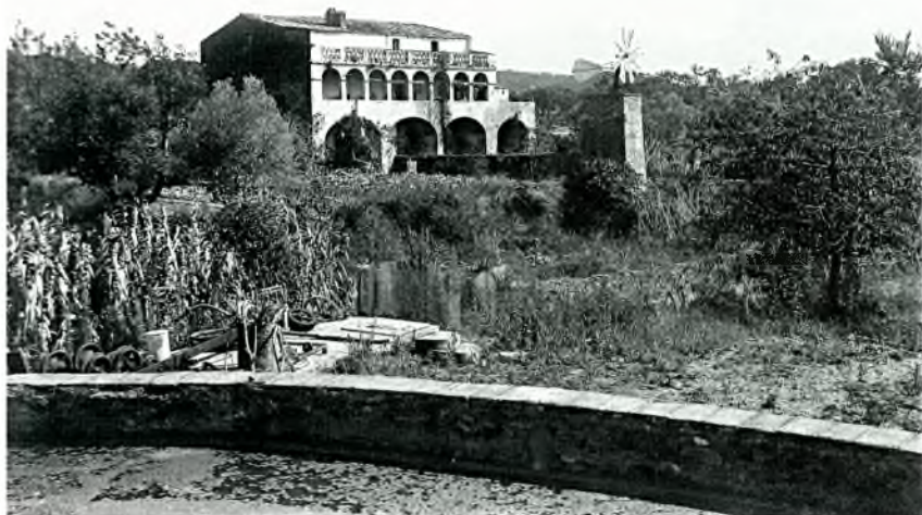
Foto núm. 7: El mas Bou de Fonts cap al 1900, quan encara era dels descendents de la família Vidal àlies Bou del segle XIV.

més complexa i té com a objectiu primordial aconseguir una comprensió global d'aquell territori i els seus problemes 36 .