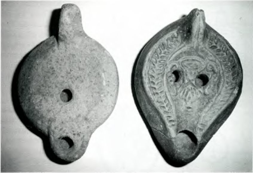
Figura 2: Fotografia de les dues llànties a les quals ens referim al llarg de l'article. El bec de la llàntia decorada fou restaurat amb posterioritat a l'estudi d'Agustí Casas. Museu d'Història de la Ciutat. Sant Feliu de Guíxols