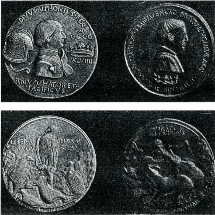
Fig.3. Medalles d'Alfons el Magnànim (Museu Arqueològic Nacional. Madrid).

la personalitat que va adquirint el municipi de Calonge davant la monarquia i la preocupació per la salvaguarda dels seus privilegis (fig. 3).