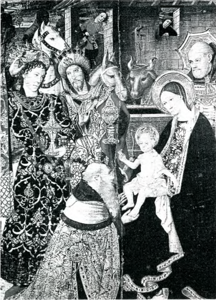
Fig. 5. Retaule del Conestable de Portugal. Obra de Jaume Huguet. Segle XV (Muscu d'Història de la Ciutat de Barcelona).

creada, precisament a mitjan segle XIII, per donar constància de l'autenticitat i la veracitat del document expedit.