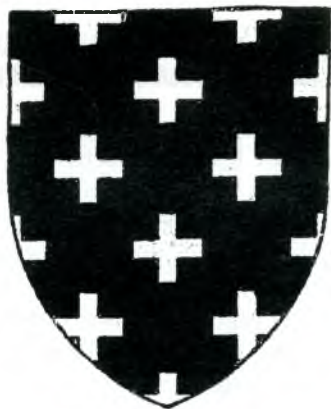
Fig. 1. Armes dels Cruïlles. De gules sembrat de creuetes d'argent.

Entre els senyors d'aquesta casa mencionarem Gilabert de Cruïlles, que es distingí en la conquesta de Mallorca, a la qual aportà trenta cavallers i els