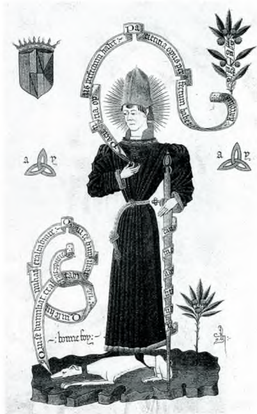
Fig. 4. El príncep de Viana. (còdex de la Biblioteca Nacional. Madrid).

A l'Arxiu de la Corona d'Aragó i a la sèrie de registre de la Reial Cancelleria, concretament en el registre 3387 (folis 115-117 v o ) hi ha la còpia d'un document del rei Joan II, dirigit al noble Martí Guerau de Cruïlles, que, per donar prova fidedigna del seu contingut, substitueix àmpliament l'original, que no hem pogut localitzar, perquè la Reial Cancelleria fou