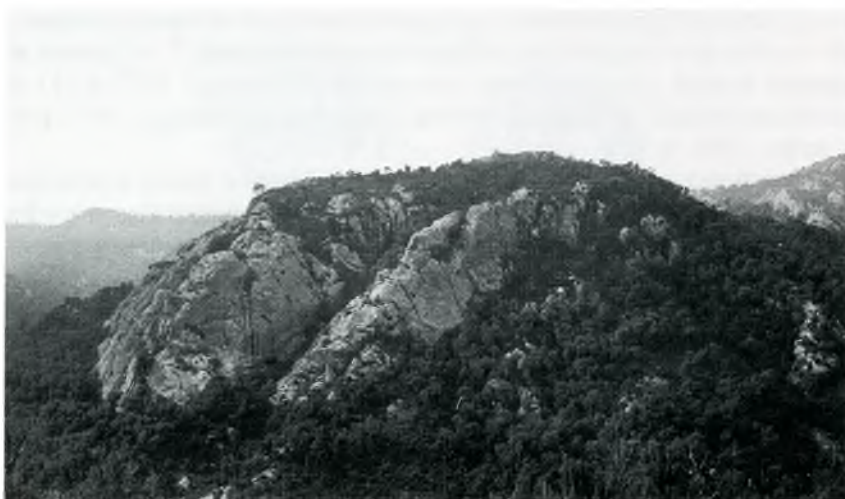
Fig. 2. Vista general de Plana Basarda en el Massís d'Ardenya.