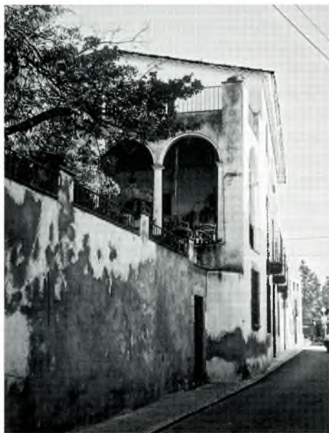
Fig. 6. Casa de Josep M a Vilaseca (carrer de la Rutlla).

Els metges de Calonge varen viure bé, però mirant el que gastaven.