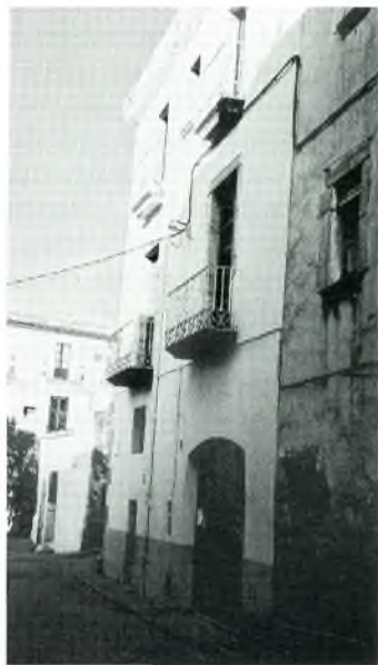
Fig. 5. Casa de Francesc Xipell (carrer Sant Joan o de l'Educació)