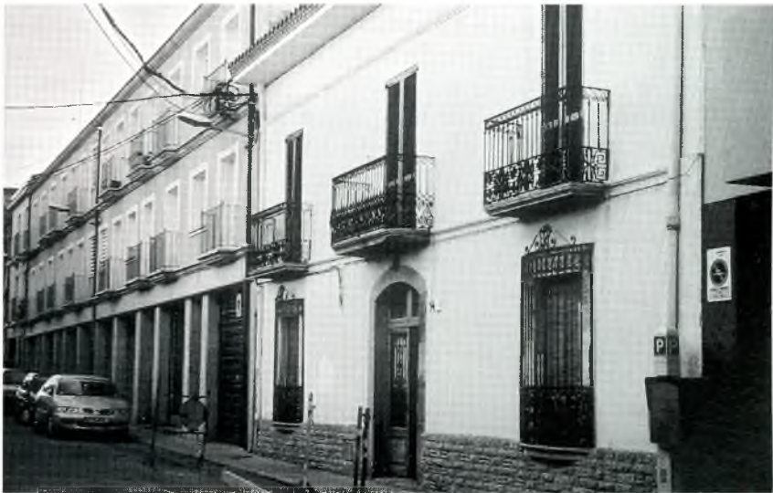
Fig. 7. Casa de Joan Turró (carrer de la Rutlla).

Quan vaig arribar a Girona, la tardor de 1931, per començar el batxillerat, un dels aspectes que destacaven era la radicació de dos regiments de soldats: l'un era d'artilleria pesada, els servidors del qual eren nois bastant benplantats, i l'altre d'infanteria, els membres del qual no anaven amb camió com els primers sinó a peu, i portaven un màuser penjat del muscle esquerre, arma que quasi tenia tanta llargada com l'alçària del noi, o bé servien d'atzemblers dels muls que transportaven les metralladores i la munició. Aquests eren nois d'estatura notablement escassa, fins al punt que els marrecs que estrenàvem batxillerat, els qualificaven de "pipis". Procedien de zones en general deprimides i eren enviats al Principat pel costum de portar els quintos a complir el servei militar lluny del lloc de naixença.