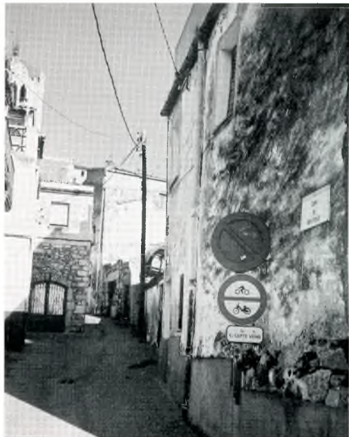
Fig. 2. Carrer de Genís Ponjoan

Tornant a la realitat, aquesta curiosa tendència és molt probable que tingui relació purament amb el desig d'ajudar el proïsme.