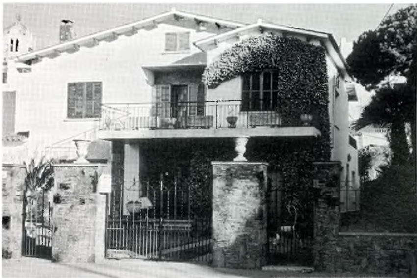
Fig. 9. Casa d'Agustí Cortés (avinguda Sant Jordi).

El berenar, a les 5 de la tarda, era senzill: pa de llesca amb sal, oli i llonganissa, o bé pa sucac amb vi i ensucrat, o torrada amb una mica d'arengada o bescuits de forner amb xocolata.