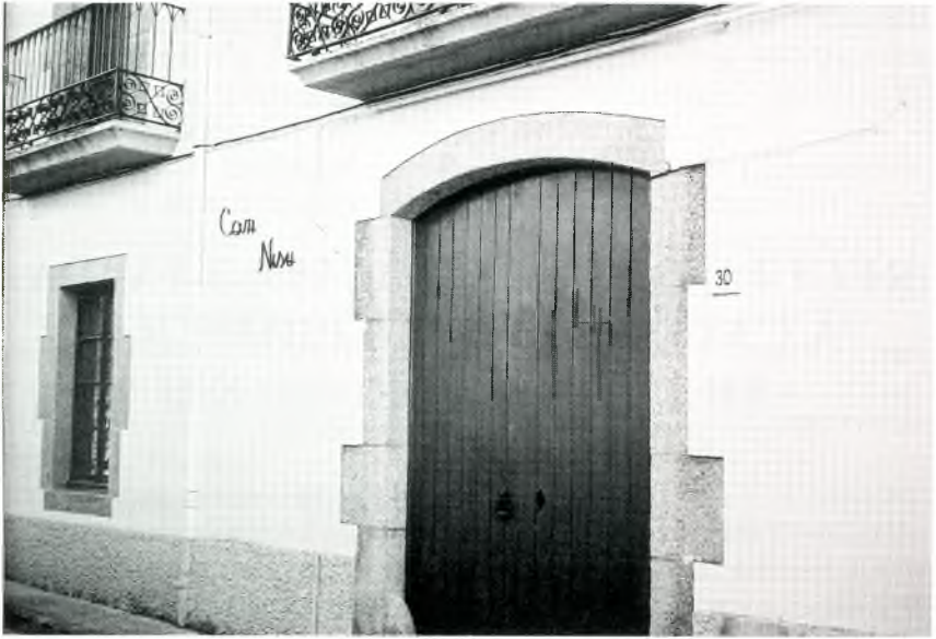
Fig. 1. Casa de Genís Ponjoan, "Can Nisu" (carrer Sant Joan o de l'Educació).

En aquest període també estudiaren medicina –i la majoria encara l'exerceixen– 9 ciutadans més, entre els quals hi ha les primeres 2 noies – ara ja mares de família–, fills o néts, la majoria, d'algun dels 18 metges referits, i que, si bé no han nascut a Calonge, sí que han estat ben relacionats amb la vila. Els podem considerar fills de Calonge i així seríem 27 en total.