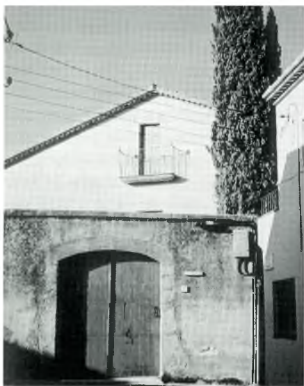
Fig. 3. Casa de la família Ponjoan (carrer Pedró)

L'altra malaltia eren les febres tifoparatífiques, veritable cavall d'Atila d'estius i tardors. Tinc el record d'haver vist transportar a l'esquena de dos homes la banyera de La Germandat; que