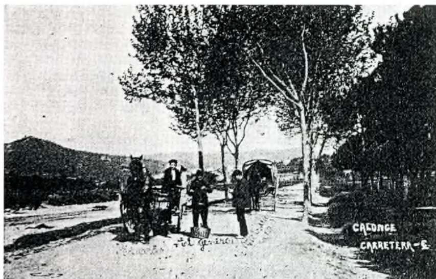
Fig. 10. L'ordinari. Servei diari de paquets.

A pesar que la certa preocupació actual per por de la possibilitat, molt llunyana, de la encefalopatia espongiforme llavors no existia, a l'escorxador de Calonge no se sacrificaven vedelles, bous ni vaques, ni tampoc cavalls. Es va haver d'arribar a l'any 1937, amb l'escassetat d'aliments, perquè es comencés a vendre vedella congelada procedent de l'Argentina.