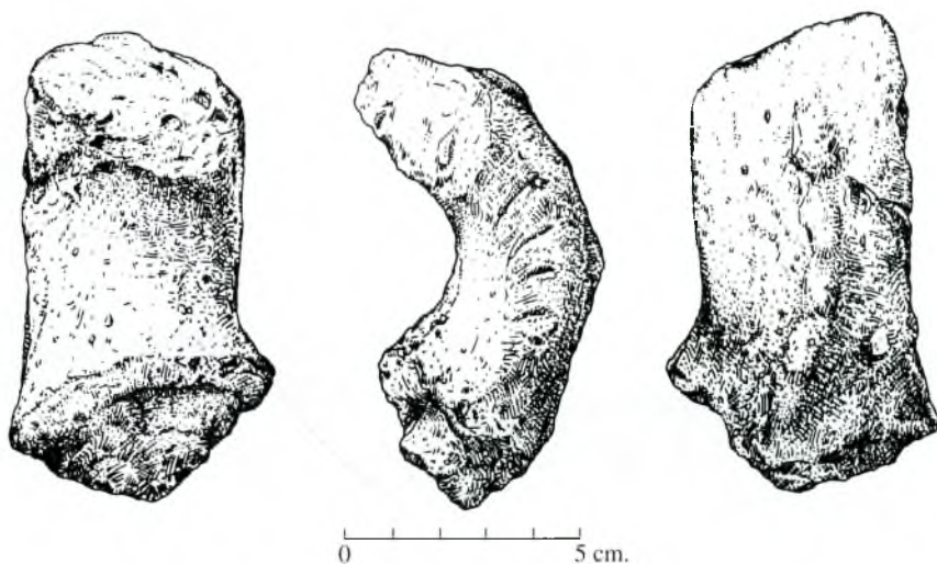
Fig. 11. Fragment de nansa. Conserva part de decoració en un dels costats. Encara hi són visibles 4 o 5 incisions. També conserva decoració de cordó aplicat que fa cresteria. (Dibuix de l'autor.)