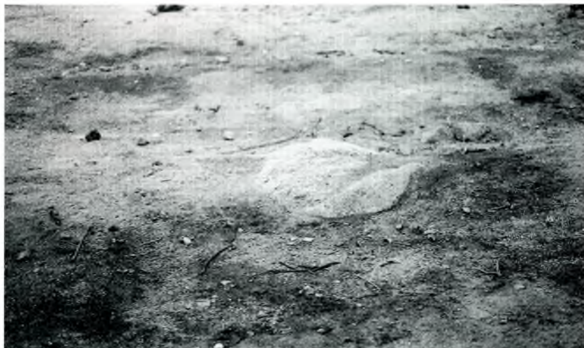
Fig. 3. Sòl amb restes carbonitzades al puig Gros. Descartem una possible carbonera per ser un lloc massa elevat als vents. Les restes de ceràmica avalen, també, la nostra percepció.

En el moment de recopilació de dades l'any 1983, els llocs (pla de les Mòdegues, camí Romà, puig Gros i un ample entorn) oferien un aspecte desolador a causa d'un incendi. A conseqüència d'aquest, és quan es fan localitzacions arqueològiques d'interès. Amb anterioritat al foc, l'indret era molt ufanós en vegetació de tota mena, la qual protegia, tapava o mimetitzava les restes d'ocupació humana.