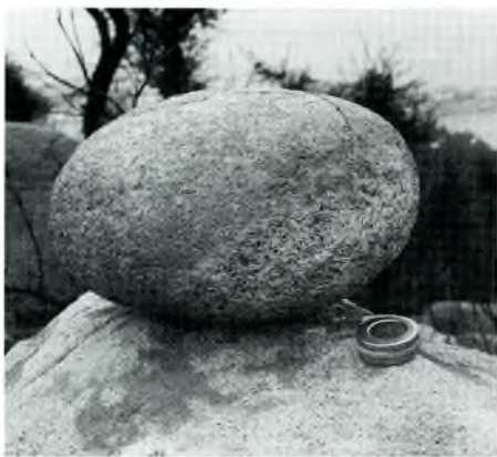
Fig. 6. Còdol de grandària considerable. Al fons, la punta de Garbí i s'Adolix s'endinsen al mar.

Bases de molins de "vaibé", sencers o fragmentats, mans de morter, percutors, polidors i còdols s'han anat trobant en el perímetre de dispersió que anomenem puig Gros. Quan diem còdols ho fem amb l'evidència de la seva procedència marina, per la proximitat a la línia costanera, pel rodament sofert i per la gran distància per a trobar un riu prou cabalós que els pugui produir. Des de cala