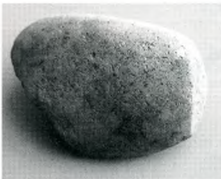
Fig. 8. Còdol on són ben visibles les parts d'adaptació al poliment.

Vigatà fins a Tossa, els còdols hi són presents en abundància i ofereixen forma i densitat notable per a fer-los servir com a percutors.