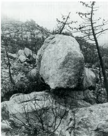
Fig. 5. Bloc granític de grandària considerable on es pot apreciar la concavitat a la base.

D'aquesta descomposició es formaren dos petits plans que anomenem 1 i 2, els quals s'estenen des de la base de la torre de TV, en direcció NE, fins als cingles. Per sota d'aquests i en direcció cap a l'est, on comença l'empedrat del camí Romà, hi ha el pla de les Mòdegues. Del pla de les Sorres, a l'oest del collet de la Mare de Déu, no en podem dir gaire res, ja que ha estat poc prospectat.