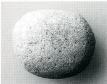
Fig. 7. Percutor bidistal de pòrfir granític.