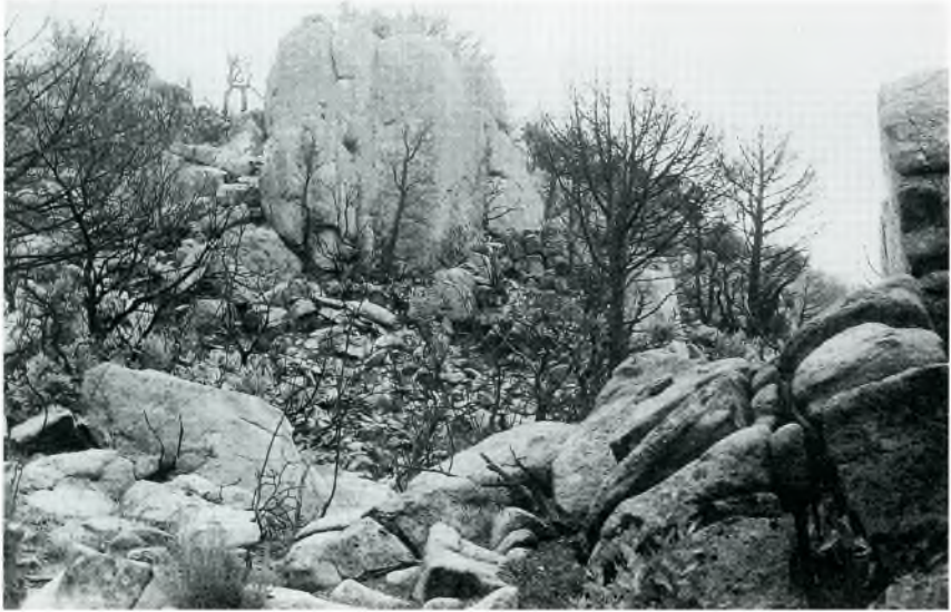
Fig. 4. Granit de l'entorn del puig Gros amb les seves formes de descomposició.

Al puig Gros i al seu entorn hi abunda el rocall de granit, en procés gradual de descomposició, amuntegat o dispers juntament amb vegetació.