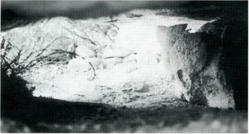
Fig. 13. Covatxa on s'endevinen, al fons, restes de parament d'adaptació.