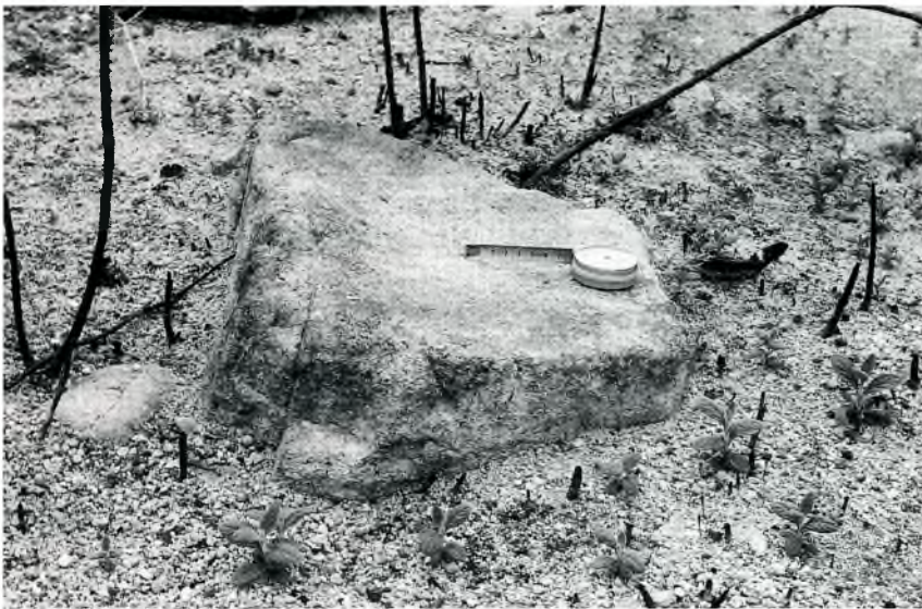
Fig. 14. Molí en el seu lloc. Té una superfície lleugerament cònca i molt regular. És de gran mida i està encastat a terra.

Un bon indret, amb suficient espai proper per a dur-hi a terme tasques de conreu, podria ser el lloc de les Sorres, que en el seu moment no fou investigat, ja que no va ser una de les zones afectades pel foc. Per voler donar utilitat al nombre de molins de mà localitzats, s'ha d'associar a l'activitat d'una probable mòlta de gra, per a la qual el conreu de cereals és la font primària, i l'espai de les Sorres podria ser l'espai ideal.