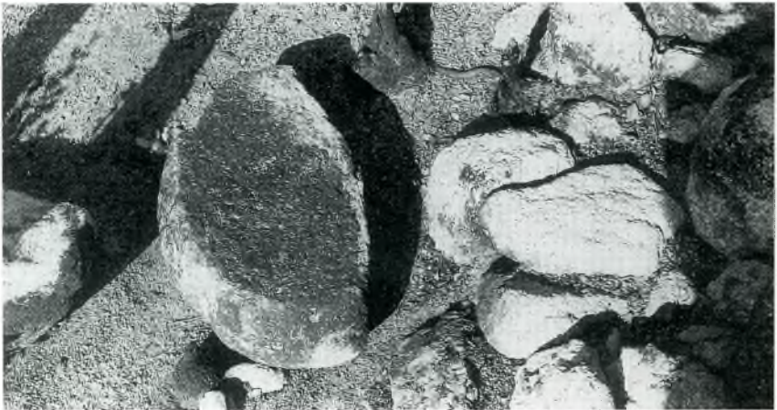
Fig. 2. A diferència d'altres pedres, una destaca per la part planera i afectada pel fum, és un molí de "vaibé".

A excepció de les coves excavades del turó de l'Àliga, del mas Assols i de la costa d'en Cirera, amb les posteriors prospeccions portades a terme i amb la localització d'altres cataus, podríem parlar d'un jaciment inèdit de més extensió, dins del qual s'englobarien aquests tres punts esmentats.