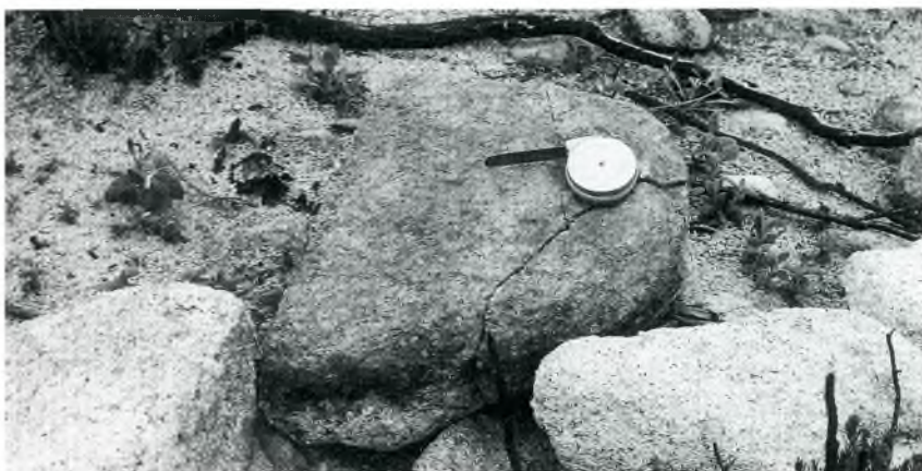
Fig. 9. Molí de granit de gra gros.

Els còdols projectils són semblants en mida als d'altres