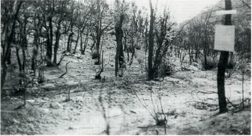
Fig. 1. Aspecte desolat del pla de les Mòdegues. Un rètol generós hi aparegué dies després amb un bonic text de lament.