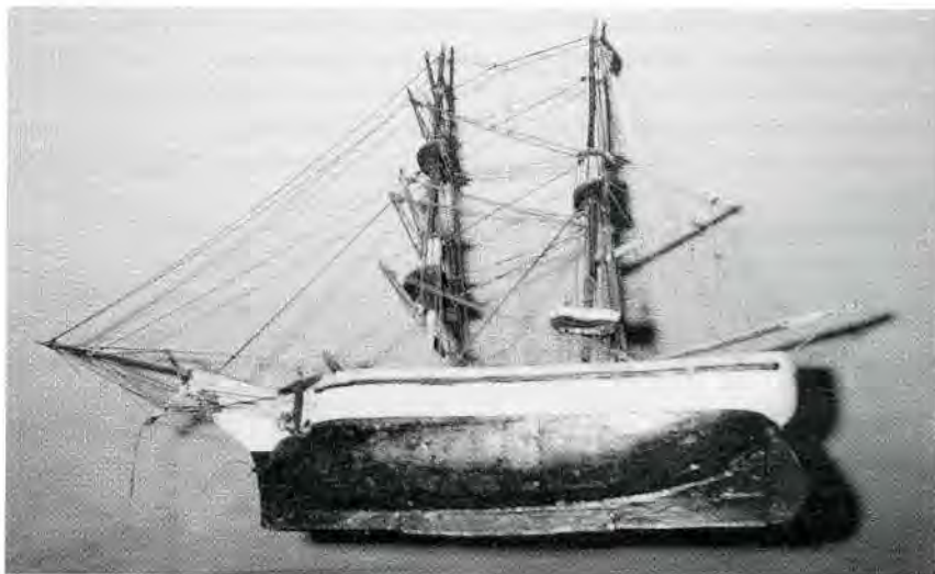
Maqueta del veler "Maizales" dels Carreres, que feia la ruta antillana.