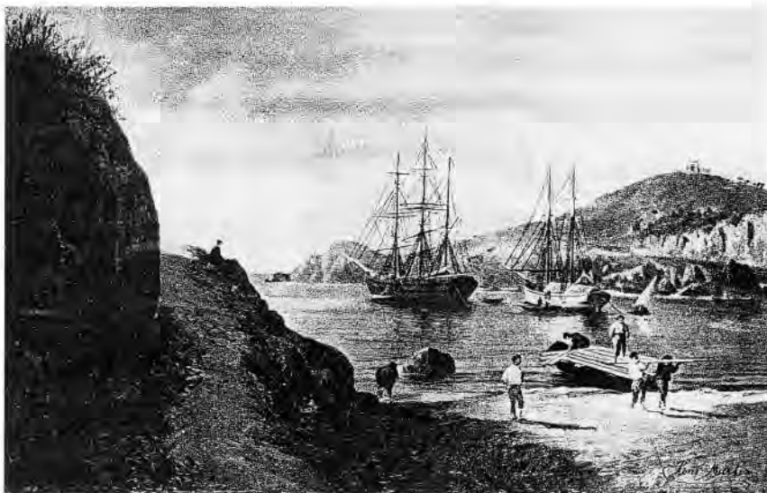
El port de Sant Feliu de Guíxols del vuitcents segons un quadre de Pons Martí.

Barre, governador de Girona, demanà informació sobre l'ofici dels tapers. Els edils locals li comunicaren que hi havia treballant a Sant Feliu uns 250 fabricants de taps, 20 de carredors i 25 de toscadors i bullidors. En total 295 fabricants, que hem d'entendre com a modestos artesans tapers que amb ajudes familiars i l'ajut d'algun treballador mantenien petits obradors on s'elaboraven els taps a mà.