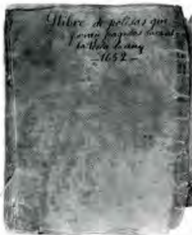
Portada del llibre de rebuts de Palafrugell, del 1652.

Molt diferents són els tractaments que s'intueixen pel llibre de rebuts de què tractem. Es basa en l'alimentació, la neteja i les cures. Una bona alimentació és molt important, i resulta difícil en temps de guerra i males collites. Les males collites són degudes a catàstrofes climàtiques i a la presència de tropes al camp, a part de l'abandó de terres pels pagesos que són cridats a files.