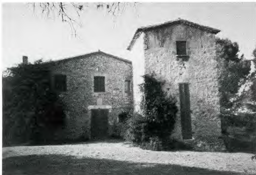
Fig. 4. Façana sud de la torre Bertrana.

Actualment, una part de la masia, sense restaurar, és destinada a tancar-hi bestiar; l'altra part és utilitzada com a segona residència.