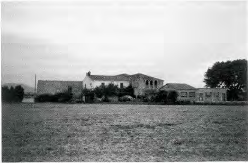
Fig. 10. Façana sud del mas Pagès. La torre era al cos on es veuen els badius.