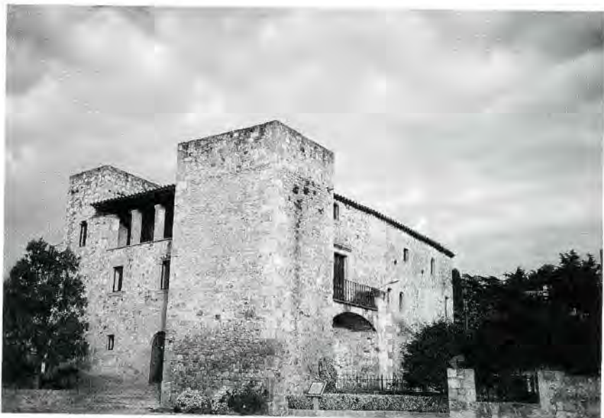
Fig. 2. L'antic mas Illa, avui ca la Pruna.

edificació. Per altra banda, si bé és cert que les dades recollides no permeten seguir fil per randa la història genealògica dels Illa i dels Ciurana, sembla evident que els dos llinatges estaven emparentats.