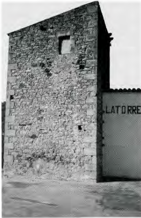
Fig. 1. Façana est de la torre Canera.