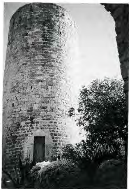
Fig. 9. La torre de les Hores, des del carrer del mateix nom.