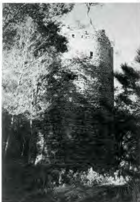
Fig. 8. Façana sud de la torre Mora.

primer pis de la casa, per un passadís cobert construït al damunt del petit pont que ja hi havia originàriament. A la banda nord de la torre s'hi conserva un matacà; l'obertura més gran es pot veure a la cara sud, a l'alçada del primer pis. Aquesta masia, la trobem documentada el 1653; el cognom Tomasí es troba, però, el 1576 amb motiu de la mort de Madó Tomasina, esposa de Toni Tomasi. El 1716 trobem «la Vinya Thomasina» que devia ser propietat dels Tomasí.