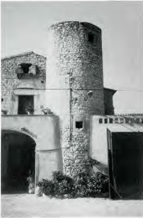
Fig. 6. Façana sud de la torre de la Casa Nova, amb el matacà a l'esquerra.

que li arriba fins més amunt de mitja alçada, de manera que només se la pot contemplar en tota la seva alçada per la part de migdia. En aquesta cara hi ha dues finestres, una dalt de tot i l'altra, més petita, força més avall; a la part esquerra, a la mateixa façana de la casa, s'hi conserva un matacà. La torre, que és coberta amb teulada d'un sol vessant, conté una escala de cargol per on es puja al pis del mas i s'acaba, aparentment, amb una volta esfèrica de pedra. Damunt d'aquesta volta, però, la torre continua en uns dos metres més d'alçada. Les dues parts de la torre es comuniquen amb una trapa (17) , fins no fa gaire tapada amb una llosa. Actualment, es pot accedir a aquesta estança superior de la torre