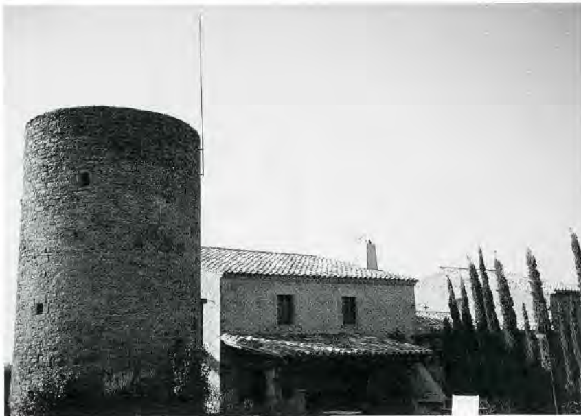
Fig. 3. Façana est de la torre Padrissa