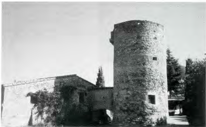
Fig. 7. Façana oest de la torre del mas Tomasí.

Aquesta edificació és situada a la sortida dels Masos de Pals, a mà dreta en direcció cap a la platja i conserva una torre de base rodona, atalussada. Es pot accedir a la torre, que ara és de planta única, des del