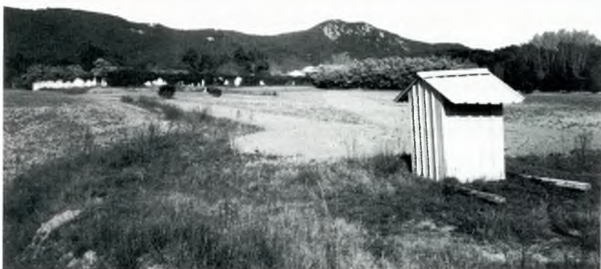
Pou de mas Reixac. En segon terme, la masia i, al fons, Roca Rubia o Roca Rovira.