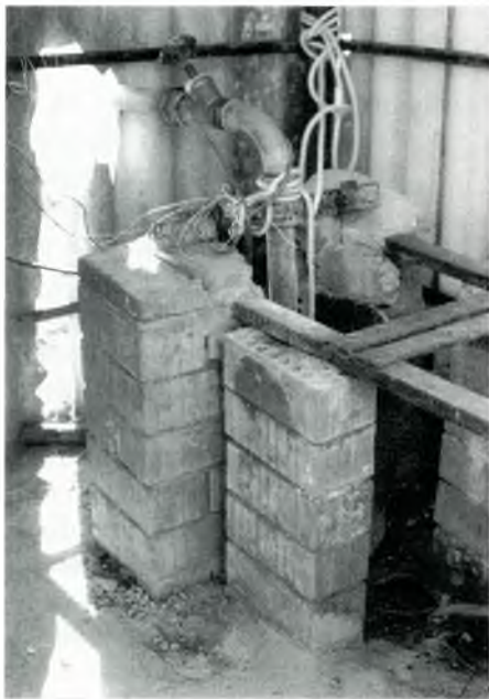
Interior de la captació del pou de mas Reixac.

Aquesta activitat de carboni modern prové del \text{CO}_2 atmosfèric dissolt en l'aigua de pluja i incorporat a l'aquífer a