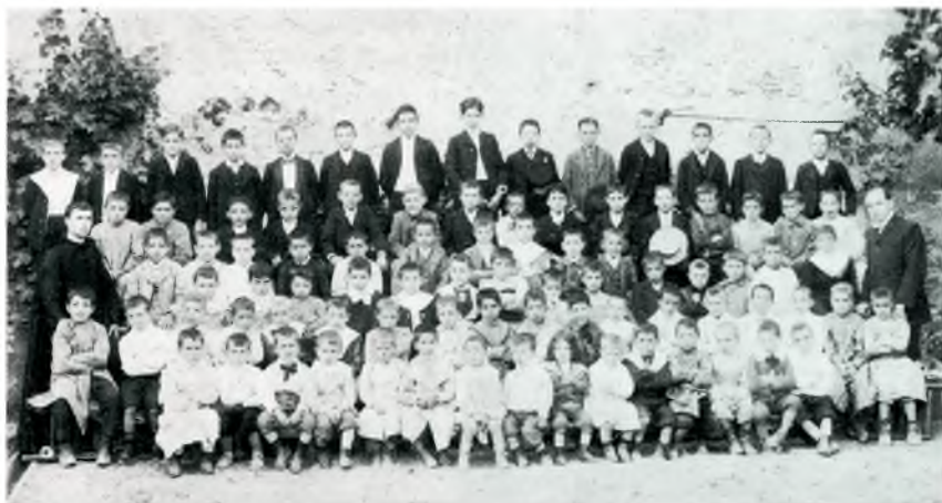
Alumnes del coll.legi de Ntra. Sra. del Carme de Begur, l'any 1906

fou immediata, i esgrimint una irònica rialla, va manifestar: “És molt bonic estimar la Pàtria, però la Pàtria on s’ha nascut”. Mossèn Jaume Plana procurà inculcar entre els infants i joves de Begur la concepció de Catalunya com a pàtria pròpia dels catalans. Constantment repetia: “Hem de ser homes d’un bell sentit, per Déu i Pàtria si ens cal morir”, i matisava que de Pàtria només n’existia una, igualment com de Déu i de mare. Concepció Pi ha explicat la profunda petja que deixà mossèn Planas en el poble, i com els homes de la Dictadura el fustigaren per les seves activitats.