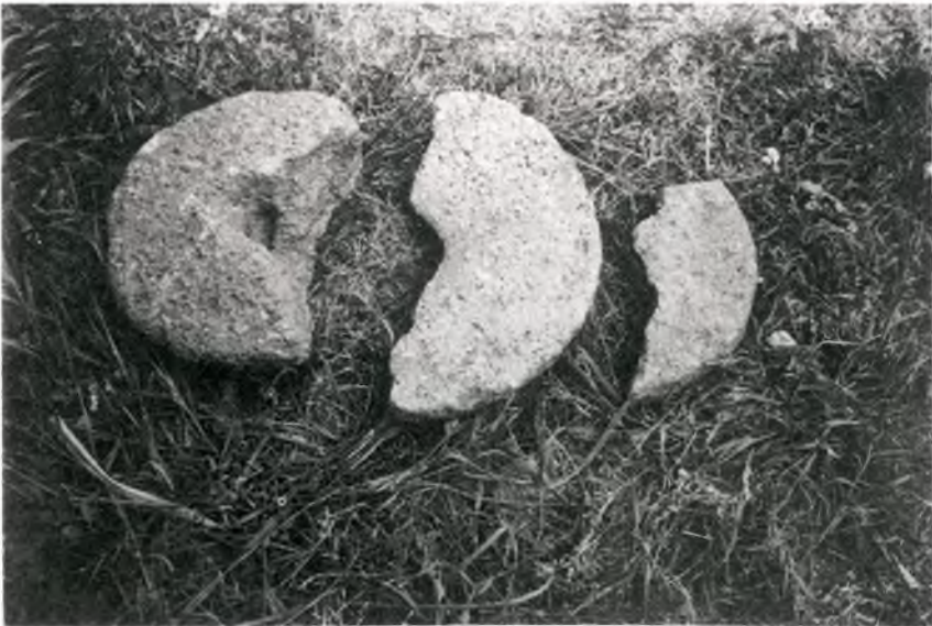
Fig 3. Fotografia del mateix molí, i d'un fragment d'un altre; el darrer trobat al jaciment de cal Pitxo.