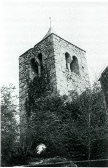
Església de Sant Martí de Romanyà; part del campanar, probablement construïda el 1517.

celonesa per aquests termens y paguas, ço és, de assí a la festa de Sant Pere y Sant Faliu set liures y de aquí a la festa de Sanct Miquel de satembre, prop venidors, altres set liures, e les restants vuyt liures e deu sous com la dita obra sia acabada bé e degudament, a coneguda de mestres. E per attendre e complir les coses dessus dites, totes y sengles, les dites parts y cascuna dellas ne obligan tots lurs bens mobles e immobles y presents y sdevenidors y axí lo prometen y juran largament.