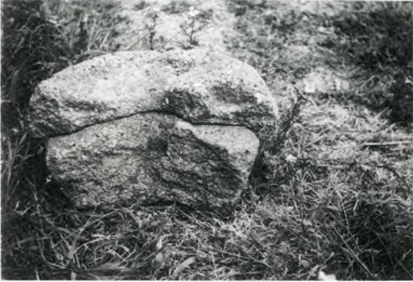
Fig 2. Fotografia del molí de mà trobat al bosc d'en Rabell, jaciment núm 3.