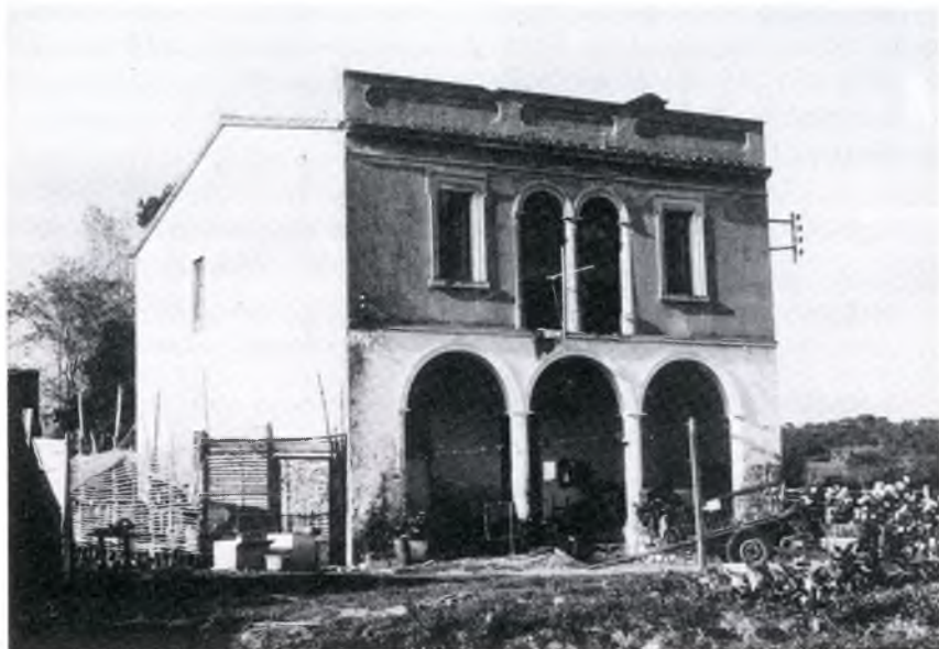
Cal Pitxo. Fotografia de Lluís Esteva, 1972.

el jaciment, sens dubte un senzill habitacle.