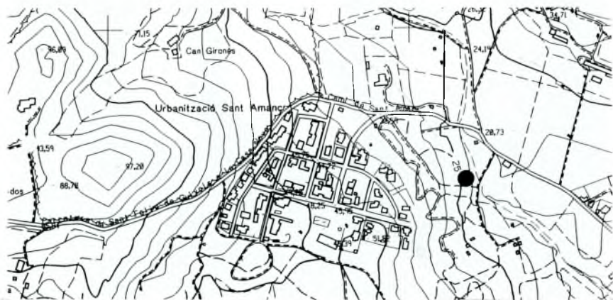
Situació del jaciment arqueològic de cal Pitxo. Mapa de l'Institut Cartogràfic de la Generalitat de Catalunya (1986). FMTN 366, full 309x107.

Can Bareia —ara cal Pitxo— és al costat mateix del camí de Sant Amanç. Per localitzar el jaciment s'han de seguir unes 40 passes des de l'acabament de la casa, seguir —per l'esquerra— un camí de carro que, tot seguit travessa la riera de Sant Amanç. Així que s'ha passat la riera — a la dreta— la muntanya agafa pendent pronunciada. A uns 10 m hi havia