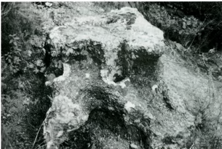
Fig 3. Fotografia de les restes del forn, vistes des del sud, en el seu estat actual. En primer terme s'observa l'engraellat, l'arrancament de la volta i el pilar central.