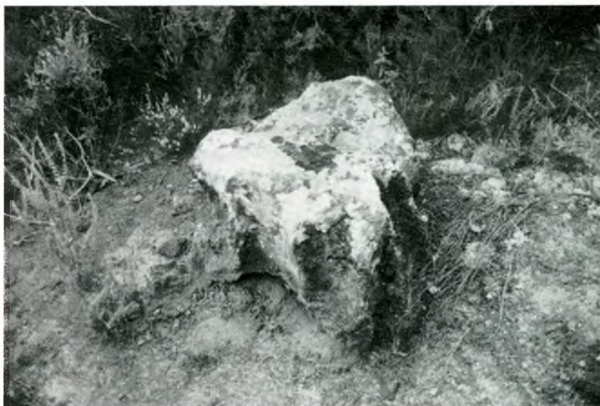
Fig 4. L'estructura vista des de l'est.