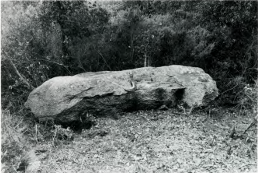
Fig 3. La Pedra Ramera, que amida 3,02 m de llargària, serví de fita entre Solius i Bell-lloc. Fotografia obtinguda el dia que el menhir va ser localitzat.

Amida 3,02 per 1,35 per 0,95 m totals. Per tant, es tracta d'un dels menhirs més grans de la comarca, bé que no sabem l'alçària total dels que encara resten plantats(fig. 3).